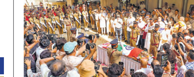
मुंबई। फिल्म अभिनेता मनोज कुमार का शनिवार को अंतिम संस्कार किया गया। इस मौके पर मनोज कुमार को श्रद्धांजलि अर्पित हुए पुलिसकर्मी।