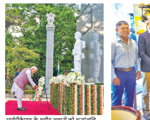
आईपीकेएफ के शहीद जवानों को श्रद्धांजलि अर्पित करते पीएम मोदी।

प्रधानमंत्री मोदी का कोलंबो के मध्य में स्थित ऐतिहासिक स्वतंत्रता चौक (इंडीपेंडेंस स्क्वायर) पर शनिवार को भव्य स्वागत किया गया। श्रीलंका के राष्ट्रपति अनुरा कुमारा दिसानायके ने पीएम मोदी का स्वागत किया। अधिकारियों ने कहा कि यह पहला मौका है जब किसी अन्य देश के नेता का स्वतंत्रता चौक पर इस तरह से स्वागत किया गया।