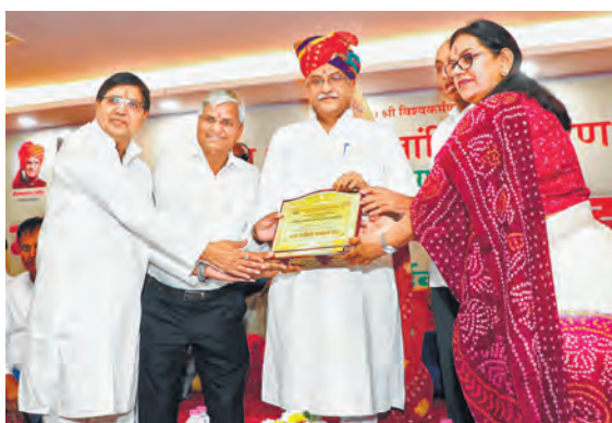
केंद्रीय मंत्री गजेंद्र सिंह शेखावत का स्वागत करते महासभा के पदाधिकारी।

केंद्रीय संस्कृति एवं पर्यटन मंत्री गजेंद्र सिंह शेखावत ने कहा कि जो समाज पीछे रह जाए लोगों की चिंता करता है, वही आगे बढ़ता है। समाज की प्रगति तभी संभव है, जब कमजोर वर्ग को संबल प्रदान कर उन्हें भी मुख्यधारा में लाया जाए। शनिवार को अखिल भारतीय जांगिड़ ब्राह्मण महासभा, राजस्थान (महिला प्रकोष्ठ) के शपथ ग्रहण समारोह में शामिल हुए शेखावत ने कहा कि भगवान विश्वकर्मा द्वारा प्रदत्त सृजन क्षमता हम सभी के भीतर है, जिसके बल पर समाज ने सदैव प्रगति की है। अब आवश्यकता है इस