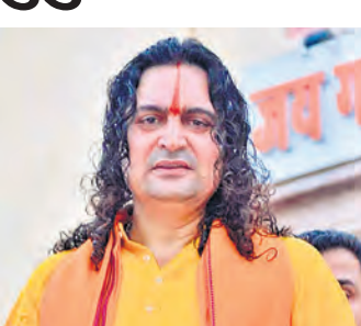
मदरसों में कोई निगरानी तंत्र नहीं है, जैसे कि सीसीटीवी कैमरे आदि। उन्होंने जिला प्रशासन से इन मदरसों की तत्काल जांच कर अवैध रूप से संचालित संस्थाओं को बंद कराने की मांग की है।