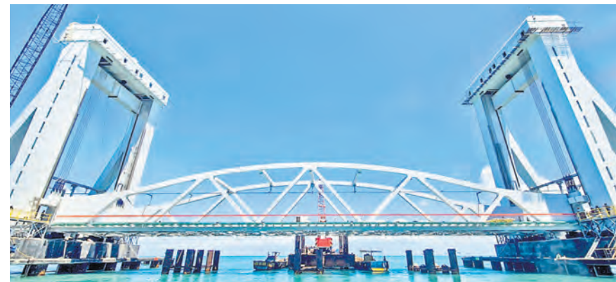
पंवन पुल वैश्विक मंच पर भारतीय इंजीनियरिंग की उल्लेखनीय उपलब्धि के रूप में खड़ा है। यह पुल 2.5 किमी से अधिक लंबा है। पुल का निर्माण करने वाले सार्वजनिक क्षेत्र के उद्यम रेल विकास निगम लिमिटेड (आरवीएनएल) के निदेशक

एजेसी। नई दिल्ली तमिलनाडु के रामनाथपुरम जिलान्तर्गत रामेश्वरम में पंवन पुल भारत का पहला वर्टिकल लिफ्ट रेलवे सी ब्रिज होगा, जो देश के रेलवे इंफ्रास्ट्रक्चर में एक महत्वपूर्ण मील का पत्थर साबित होगा। 535 करोड़ रुपये की अनुमानित लागत से बना यह पुल, जंग से क्षतिग्रस्त हुए पुराने ढांचे की जगह लेगा। यह नया पुल 100 वर्षों तक 80 किलोमीटर प्रति घंटे की गति से ट्रेन परिचालन के लिए सुरक्षित है। प्रधानमंत्री नरेन्द्र मोदी छह अप्रैल को रामेश्वरम में पंवन पुल का उद्घाटन करेंगे। रामेश्वरम को देश की मुख्य भूमि से जोड़ने वाला नया