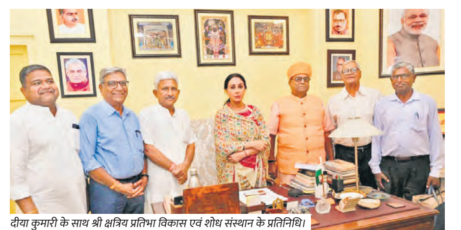
दीया कुमारी के साथ श्री क्षत्रिय प्रतिभा विकास एवं शोध संस्थान के प्रतिनिधि।