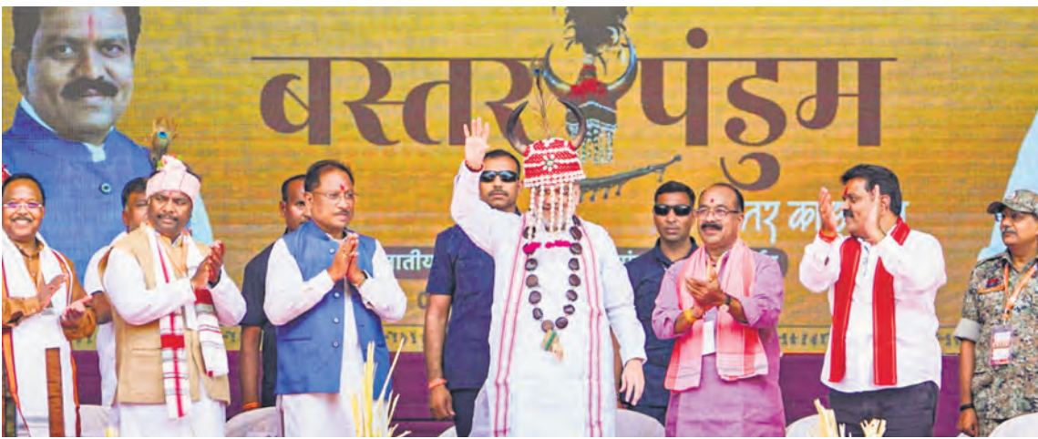
दंतवाड़ा। छत्तीसगढ़ सरकार की ओर से आयोजित बस्तर पंडुम महोत्सव के समापन सत्र में केंद्रीय गृह मंत्री अमित शाह राज्य के मुख्यमंत्री विष्णु देव साय, उपमुख्यमंत्री अरुण साव और विजय शर्मा व अन्य नेताओं के साथ।