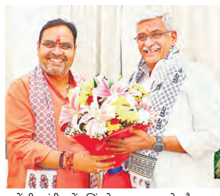
केंद्रीय मंत्री गजेंद्र सिंह ने जयपुर प्रवास के दौरान सीएम भजनलाल शर्मा से शिष्टाचार भेंट की।

क्षमता को नए तरीकों से आगे बढ़ाने की, ताकि आने वाली पीढ़ियां इससे प्रेरित हो सकें। उन्होंने कहा कि समाज को अपने पारंपरिक व्यवसायों से आगे बढ़कर नए क्षेत्रों में भी संभावनाएं तलाशनी चाहिए। युवाओं को आधुनिक