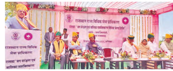
शिविर को संबोधित करते सुप्रीम कोर्ट के न्यायाधीश बीआर गवई।

राज्य विधिक सेवा प्राधिकरण एवं जिला विधिक सेवा प्राधिकरण के संयुक्त तत्वावधान में शनिवार को राजसमंद के पिपलांठी गांव में 'वन संरक्षण एवं बालिका संरक्षण-विधिक चेतना शिविर' का आयोजन किया गया। शिविर को संबोधित करते हुए सुप्रीम कोर्ट के न्यायाधीश बीआर गवई ने कहा कि देश और दुनिया में लगातार बढ़ती गर्मी पर्यावरण संतुलन पर गंभीर असर डाल रही है। अगर यह स्थिति बनी रही तो हिमालय की बर्फ पूरी तरह पिघल सकती है और नदियां सूखने से देश में जल संकट गहराएगा। न्यायाधीश बीआर गवई ने पिपलांठी गांव के पर्यावरण संरक्षण के प्रयासों की सराहना करते हुए कहा कि "मैं पिपलांठी की तीर्थयात्रा पर आया हूँ। यह मॉडल पूरे विश्व के लिए प्रेरणास्रोत है।" यहां बेटों के जन्म पर 111 पौधे लगाने और 21 हजार रुपये की