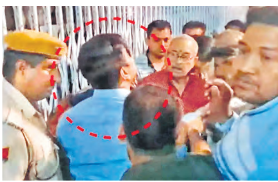
जिला कलेक्टर से हाथपाई करते कांग्रेस कार्यकर्ता व अन्य।