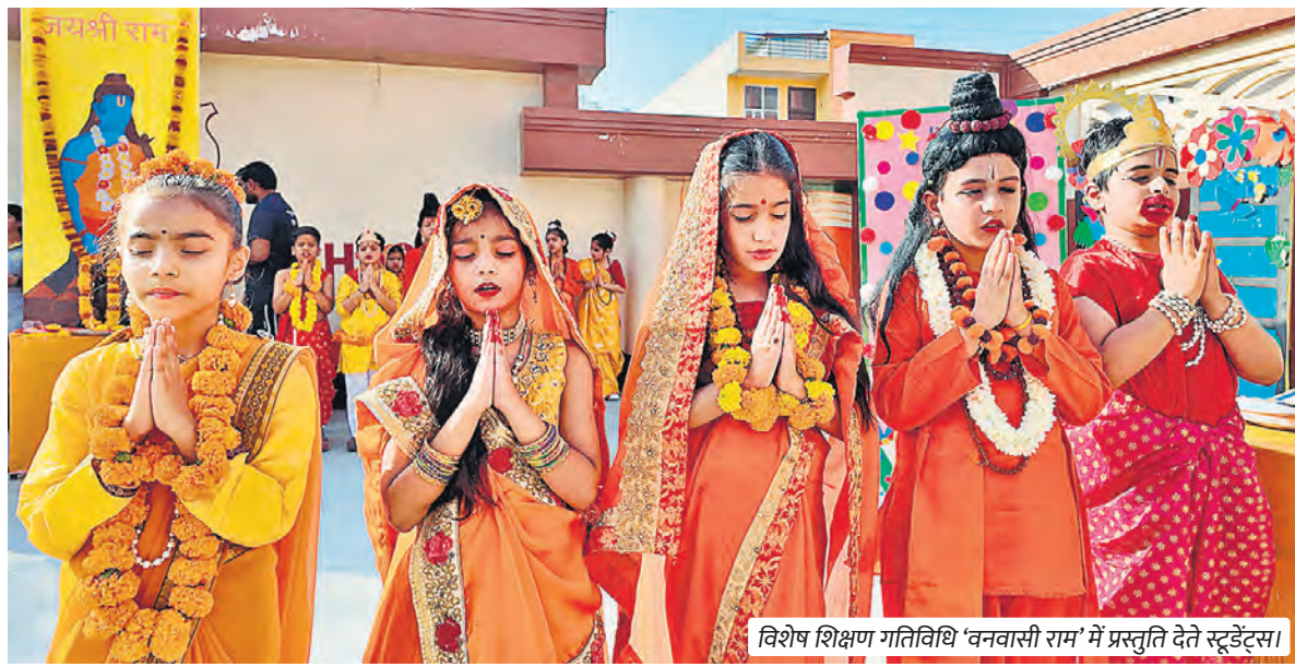
विशेष शिक्षण गतिविधि 'वनवासी राम' में प्रस्तुति देते स्टूडेंट्स।