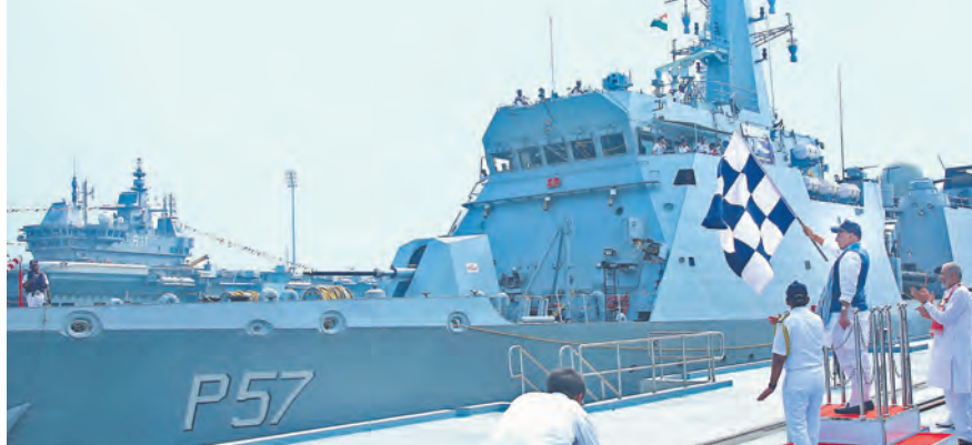
रक्षा मंत्री राजनाथ सिंह शनिवार को कर्नाटक के करवार में हिंद महासागर शिप 'सागर' को झंडा दिखाते हुए।

एजेंसी | करवार (कर्नाटक) रक्षा मंत्री राजनाथ सिंह ने शनिवार को कर्नाटक के करवार नौसैनिक अड्डे से हिंद महासागर पोत 'सागर' को हरी झंडी दिखाई और कहा कि हिंद महासागर क्षेत्र (आईओआर) में मुक्त नौवहन, नियम आधारित व्यवस्था और शांति सुनिश्चित करना भारत का सबसे बड़ा उद्देश्य है।