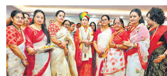
महिला प्रकोष्ठ की सदस्यों के साथ उप मुख्यमंत्री दीपा कुमारी।

अखिल भारतीय जांगिड़ ब्राह्मण महासभा, राजस्थान प्रदेश सभा के महिला प्रकोष्ठ की प्रादेशिक कार्यकारिणी का शपथ ग्रहण समारोह शनिवार को विद्याधरनगर में आयोजित हुआ। कार्यक्रम में उप मुख्यमंत्री दीपा कुमारी ने शिरकत की। उप मुख्यमंत्री ने कहा कि जांगिड़ ब्राह्मण समाज सामाजिक सेवा और उत्थान के लिए निरंतर कार्य करता आ रहा है, जो सराहनीय है। आज की महिलाएं जागरूक, सशक्त और समाज निर्माण में महत्वपूर्ण भूमिका