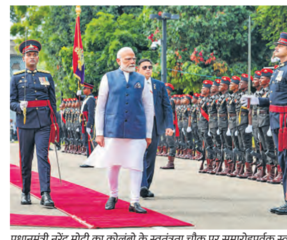
प्रधानमंत्री नरेन्द्र मोदी का कोलंबो के स्वतंत्रता चौक पर समारोहपूर्वक स्वागत।