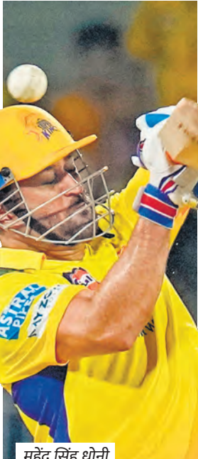
महेन्द्र सिंह धोनी

एजेसी। चेन्नई लोकेश राहुल की 51 गेंद में 77 रन की पारी के बाद गेंदबाजों के शानदार प्रदर्शन से दिल्ली कैपिटल्स ने इंडियन प्रीमियर लीग टी20 मैच में शनिवार को यहां चेन्नई सुपरकिंग्स को 25 रन से शिकस्त देकर मौजूदा सत्र में तीन मैचों में तीसरी जीत दर्ज की। दिल्ली की यह चौथा मैदान पर पिछले 15 साल में पहली जीत है। दिल्ली ने छह विकेट पर 183 रन बनाने के बाद चेन्नई की पारी को पांच विकेट पर 158 रन पर रोक दिया। चेन्नई की चार मैचों में यह लगातार तीसरी हार है। चेन्नई ने 11वें ओवर में 74 रन पर पांच विकेट गंवा दिए थे। इसके बाद विजय शंकर (नाबाद 69) और