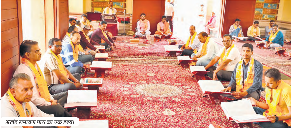
अखंड रामायण पाठ का एक दृश्य।