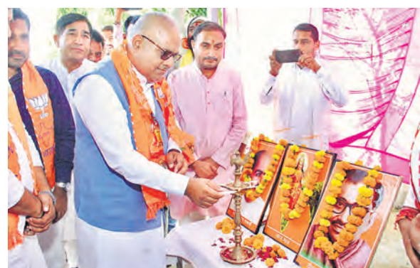
भाजपा कार्यशाला का उद्घाटन करते भूपेंद्र यादव।

भाजपा स्थापना दिवस के अवसर पर शनिवार को अलवर भाजपा कार्यालय में कार्यशाला आयोजित की गई। कार्यक्रम में केंद्रीय पर्यावरण मंत्री भूपेंद्र यादव ने पदाधिकारियों को संबोधित करते हुए कहा कि भाजपा 'वन नेशन, वन इलेक्शन' कानून लेकर आएगी, जिससे चुनाव प्रक्रिया को सरल और प्रभावी बनाया जा सके। उन्होंने कहा कि वक्क बिल, देश की सुरक्षा और गरीब कल्याण को लेकर भाजपा ने कई महत्वपूर्ण कदम उठाए हैं। भाजपा को लेकर जो गलत धारणाएं फैलाई जा रही हैं, उन्हें दूर करना जरूरी है। उन्होंने कहा कि संविधान, सामाजिक न्याय और आरक्षण को लेकर पार्टी की नीति स्पष्ट है। मंत्री यादव ने बताया कि डॉ. भीमराव अंबेडकर की जयंती पर पार्टी कार्यक्रमों का आयोजन करेगी।