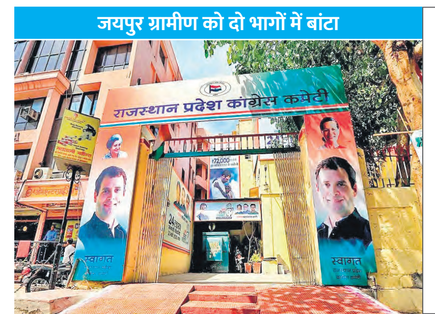
जयपुर ग्रामीण को दो भागों में बांटा

दरअसल, पूर्ववर्ती कांग्रेस सरकार के समय गठित 50 जिलों के फैसले को मौजूदा भाजपा सरकार ने खत्म कर 41 जिले रखने का निर्णय किया, लेकिन अब कांग्रेस ने संगठन के हिसाब से जिलों की संख्या 50 की है। इनमें आठ नए जिलों में कांग्रेस ने जिला संगठन बनाए हैं। नए जिलों के गठन को लेकर बीते दिनों हुई प्रदेश कांग्रेस कार्यकारिणी की बैठक में जिला कांग्रेस कमेटियों का विस्तार और पुनर्गठन कर कुल 50 जिला कांग्रेस कमिटी बनाने का प्रस्ताव पारित किया गया था, जिसका शनिवार को कांग्रेस अध्यक्ष मल्लिकार्जुन खरगे ने अनुमोदन किया है।