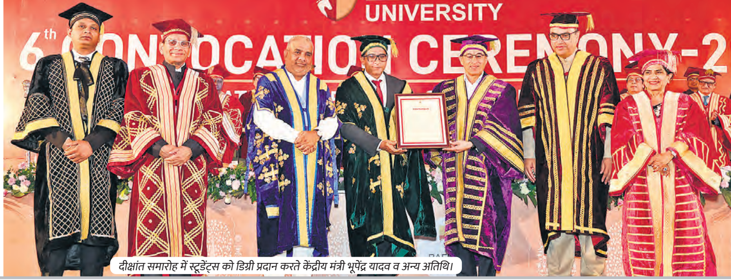
दीक्षांत समारोह में स्टूडेंट्स को डिग्री प्रदान करते केंद्रीय मंत्री भूपेंद्र यादव व अन्य अतिथि।

तो असली दुनिया का सामना करेंगे, जहां जीवन की वास्तविकताओं से सामना होगा। समारोह में अकादमिक उपलब्धियों का जश्न मनाते हुए 344 विद्यार्थियों को पीएचडी, स्नातकोत्तर और स्नातक डिग्रियां दी गईं। विभिन्न विभागों के 21 गोल्ड मेडलिस्ट्स को मेडल्स देकर सम्मानित किया गया। कार्यक्रम में सुप्रीम कोर्ट ऑफ इंडिया के न्यायाधीश जस्टिस दीपांकर दत्ता और एमार दुबई संस्थापक मोहम्मद अलब्वर विशिष्ट अतिथि रहे। मोहम्मद अलब्वर को डॉक्टरेट डिग्री (ऑनोरिस कॉसा) से सम्मानित किया गया।