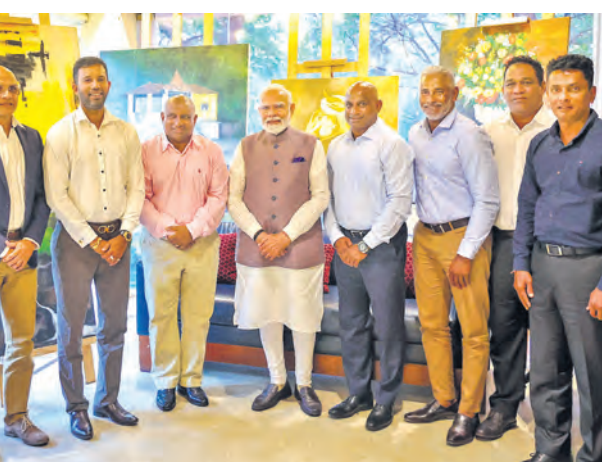
श्रीलंका की 1996 में विश्व विजेता क्रिकेट टीम के सदस्यों के साथ पीएम मोदी।

आईपीकेएफ स्मारक पर श्रद्धांजलि अर्पित प्रधानमंत्री मोदी अपनी श्रीलंका यात्रा के दूसरे दिन राजधानी कोलंबो स्थित आईपीकेएफ स्मारक गए और करीब चार दशक पहले श्रीलंका में तैनाती के दौरान शहीद हुए भारतीय शांति सेना के जवानों को शनिवार को पुष्पांजलि अर्पित की। मोदी ने सोशल