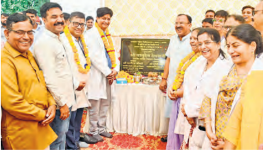
शिलान्यास के अवसर पर वासुदेव देवनानी व उपस्थित अन्य लोग।

बेधड़क। अजमेर यहां राजकीय महिला चिकित्सालय (जनाना) में 1 करोड़ 30 लाख की लागत से होने वाले कॉटेज वार्ड निर्माण कार्य का सोमवार को विधानसभा अध्यक्ष वासुदेव देवनानी ने शिलान्यास किया। इस अवसर पर उन्होंने कहा कि यह महत्वपूर्ण कार्य अस्पताल की स्वास्थ्य सेवाओं को और अधिक सुदृढ़ बनाएगा तथा मरीजों को बेहतर सुविधाएं उपलब्ध कराने में सहायक सिद्ध होगा। विधानसभा अध्यक्ष देवनानी की अनुशंसा पर इस निर्माण कार्य के लिए जिला खनिज फाउंडेशन ट्रस्ट (डीएमएफटी) फंड से 1 करोड़