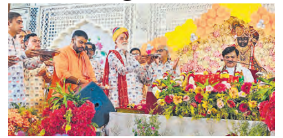
बेधड़क | जयपुर

पुरुषोत्तम मास के अक्सर पर जयपुर में विभिन्न स्थानों पर चल रही रामकथा और श्रीमद्भागवत कथाओं का सोमवार को समापन हो गया। कथावाचकों ने भगवान के नाम स्मरण, आदर्श जीवन और धार्मिक मूल्यों को अपनाने का संदेश दिया। मंगलवार को कई स्थानों पर हवन और पूजाहोत के कार्यक्रम आयोजित किए जाएंगे। विद्याधरनगर सेक्टर-2 स्थित उत्सव सामुदायिक केंद्र में आयोजित श्रीमद्भागवत कथा ज्ञान यज्ञ का विश्राम हुआ।