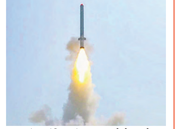
रक्षा अनुसंधान एवं विकास संगठन (DRDO) ने सोमवार को ओडिशा तट के पास डॉ. एपीजे अब्दुल कलाम द्वीप से लंबी दूरी की लैंड अटैक कूज मिसाइल (LRLACM) का सफल उड़ान परीक्षण किया। एकीकृत परीक्षण रेंज (ITR), चांदीपुर द्वारा तैनात विभिन्न ट्रैकिंग उपकरणों द्वारा एकत्र किए गए आंकड़ों के अनुसार इस परीक्षण के सभी उद्देश्य पूरी तरह से सफल रहे।