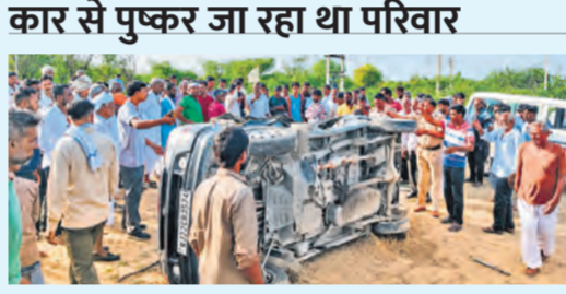
बस से टक्कर के बाद पलटी कार व मोके पर मौजूद लोग।

नागौर जिले के जसनगर क्षेत्र में सोमवार सुबह हुए हादसे में एक ही परिवार के तीन लोगों की मौत हो गई, जबकि छह जने घायल हो गए। हादसा जसनगर के पास लूनी नदी की रफ्त पर उस समय हुआ जब एक इको कार और प्राइवेट बस की आमने-सामने टक्कर हो गई। कार में जैतारण निवासी एक परिवार के नौ सदस्य सवार थे, जो सोमवती अमावस्या पर पुष्कर सरोवर में स्नान के लिए जा रहे थे। सुबह करीब सात बजे जसनगर से आनंदपुर कालू की ओर जा रही बस से उनकी कार