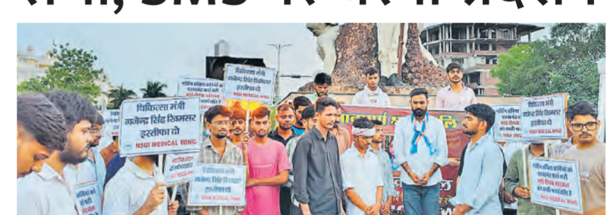
त्रिमूर्ति सर्किल पर विरोध प्रदर्शन करते नर्सिकर्मी।