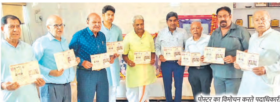
पोस्टर का विमोचन करते पदाधिकारी।

17 से 28 जून तक चलने वाले 29वें सियाराम पाटोत्सव के दौरान लक्ष्मण झूंरी का पूरा क्षेत्र राम नाम, वेद मंत्रों, सुंदरकांड पाठ और हरिनाम संकीर्तन की अनुगूंज से सराबोर रहेगा।