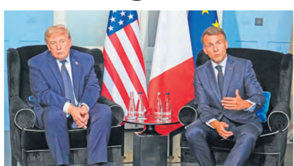
राष्ट्रपति डोनाल्ड ट्रंप सोमवार को फ्रांस के एवियन-लेस-बेन्स में G7 शिखर सम्मेलन के दौरान फ्रांस के राष्ट्रपति इमैनुएल मैकॉन से मुलाकात करते हुए।

एजेंसी। एवियन-लेस-बेन्स (फ्रांस)। अमेरिकी राष्ट्रपति डोनाल्ड ट्रंप जी-7 शिखर सम्मेलन में भाग लेने के लिए सोमवार को फ्रांस पहुंचे, जहां वह दुनिया के प्रमुख औद्योगिक देशों के नेताओं के साथ बैठक करेंगे। राष्ट्रपति जी-7 बैठक के मौके पर जिन नेताओं के साथ वे बातचीत भी करेंगे, उनमें कुछ नेता ऐसे भी हैं जो ईरान युद्ध में अमेरिका की रणनीति के विरोधी रहे हैं।