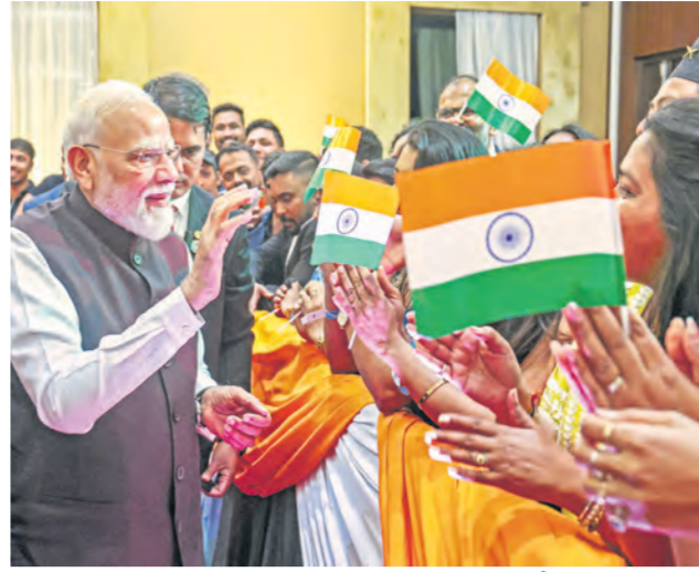
प्रधानमंत्री नरेंद्र मोदी स्लोवाकिया में एक स्वागत समारोह के दौरान भारतीय समुदाय के लोगों से बातचीत करते हुए।