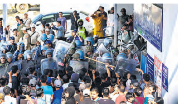
इंपाल में सोमवार को सुरक्षाकर्मी रिजलेंट इंस्टीट्यूट ऑफ मेडिकल साइंसेज (RIMS) के पास प्रदर्शनकारियों को रोकते हुए।

सभी घायल कुकी समुदाय से हैं, जिन्हें सुरक्षा बलों ने इलाज के लिए इंपाल स्थित क्षेत्रीय आयुर्विज्ञान संस्थान (रिस्प) पहुंचाया। इस बीच, रिस्प परिसर में उस समय तनाव उत्पन्न हो गया, जब प्रदर्शनकारियों के एक