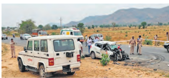
दुर्घटनाग्रस्त कार व मोके पर मौजूद पुलिस।

बेधड़क। बीकानेर/ नागौर प्रदेश में सोमवार को हुए दो भीषण सड़क हादसों ने कई परिवारों की खुशियां छीन लीं। बीकानेर और नागौर जिलों में हुई अलग-अलग दुर्घटनाओं में कुल 9 लोगों की मौत हो गई, जबकि 7 लोग घायल हो गए।