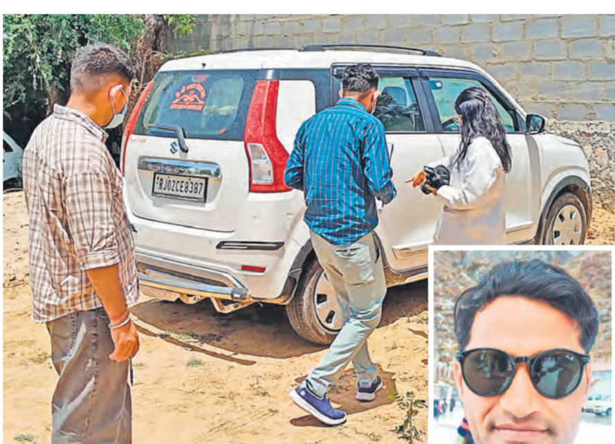
कार से साक्ष्य जुटाती एफएसएल टीम।

हत्या के बाद शव को कार में रखकर दो दिन तक घुमाता रहा आरोपी