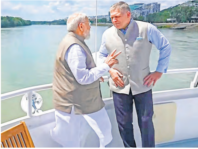
प्रधानमंत्री नरेंद्र मोदी स्लोवाकिया के ब्रातिस्लावा में अपने स्लोवाक समकक्ष रॉबर्ट फिको के साथ 'हाई टी' मीटिंग के दौरान बातचीत करते हुए।