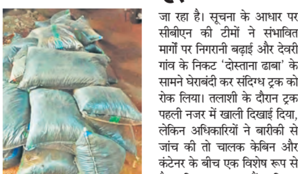
ट्रक से बरामद डोडा चूरा से भरे कट्टे।