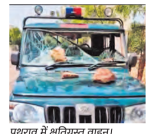
पथराव में क्षतिग्रस्त वाहन।