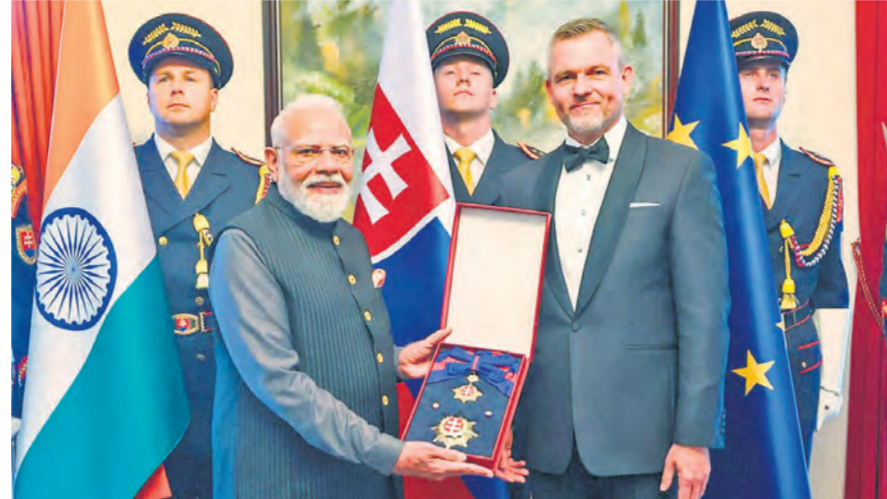
प्रधानमंत्री नरेंद्र मोदी को स्लोवाकिया के सर्वोच्च नागरिक सम्मान 'ऑर्डर ऑफ द व्हाइट डबल क्रॉस (फर्स्ट क्लास)' से सम्मानित करते राष्ट्रपति पीटर पेलेग्रीनी।

भारत-स्लोवाकिया मित्रता को समर्पित किया पुरस्कार