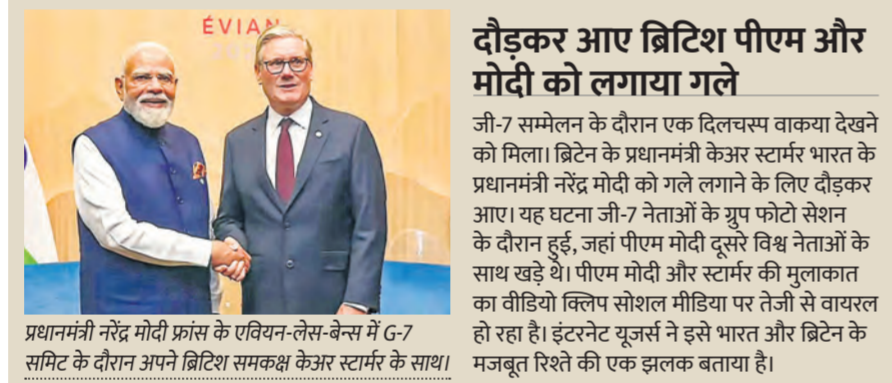
प्रधानमंत्री नरेंद्र मोदी फ्रांस के एवियन-लेस-बेन्स में G-7 समिट के दौरान अपने ब्रिटिश समकक्ष केअर स्टार्मर के साथ।