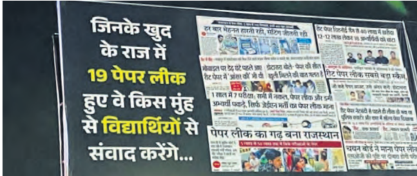
कोटा में लगे बड़े होर्डिंग्स।

भाजपा का आरोप है कि जब 21 जून को नोट यूजी की दोबारा परीक्षा होने जा रही है और ऐसे संवेदनशील समय में छात्रों को बड़े राजनीतिक कार्यक्रम में शामिल करने का प्रयास उनकी पढ़ाई और मानसिक संतुलन को प्रभावित कर सकता है। वहीं कोटा में लगे बड़े होर्डिंग्स भी चर्चा का विषय बने हुए हैं। भाजपा ने कांग्रेस पर निशाना साधते हुए सवाल उठाए हैं कि ‘जिसके राज में 19 पेपर लीक की घटनाएं हुईं, वह