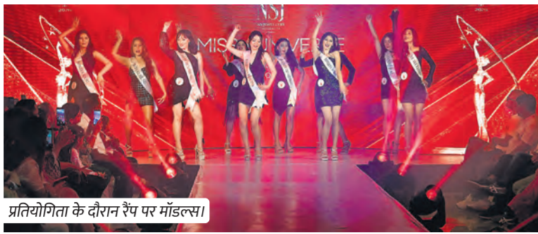
प्रतियोगिता के दौरान रैंप पर मॉडल्स।