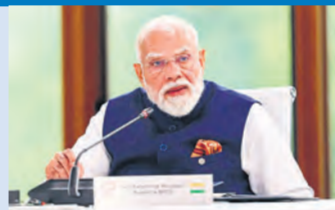
सहयोग की सबसे बड़ी पूंजी है। प्रधानमंत्री ने कहा कि भारत हमेशा 'मानवता प्रथम' के सिद्धांत पर चला है। अंतरराष्ट्रीय सौर गठबंधन, आपदा प्रतिक्रिया प्रसंरचना गठबंधन, वैश्विक जैव ईंधन गठबंधन,

प्रधानमंत्री नरेंद्र मोदी ने जी-7 शिखर सम्मेलन के संपर्क सत्र में वैश्विक सहयोग और साझेदारी का नया दृष्टिकोण पेश करते हुए कहा कि दुनिया को अब 'दानदाता और प्राप्तकर्ता' की सोच से आगे बढ़कर एकजुटता, विश्वास और समानता पर आधारित साझेदारी विकसित करनी चाहिए। 'नई साझेदारियां तैयार करने और अंतरराष्ट्रीय एकजुटता को पुनर्स्थापित करने' विषय पर आयोजित सत्र में मोदी ने कहा कि तेजी से परस्पर जुड़ती दुनिया में विश्वास ही सफल वैश्विक