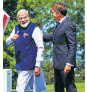
फ्रांस के एवियॉन-लेस-बेन्स में जी-7 समिट के लिए प्रधानमंत्री नरेंद्र मोदी का स्वागत करते फ्रांस के राष्ट्रपति इमैनुएल मैक्रॉन।

मिशन लाइफ और 'एक पेड़ मां के नाम' जैसी पहलें इसी सोच का प्रतिबिंब हैं। उन्होंने कहा कि भारत का वैश्विक दृष्टिकोण 'वसुधैव कुटुंबकम' की भावना पर आधारित है और देश सतत एवं समावेशी वैश्विक विकास को आगे बढ़ाने के लिए पूरी तरह प्रतिबद्ध है। सत्र में फ्रांस, इटली, ब्रिटेन, ब्राजील और यूरोपीय संघ सहित कई देशों के शीर्ष नेताओं ने भाग लिया। जी-7 सम्मेलन से इतर प्रधानमंत्री मोदी विभिन्न देशों के नेताओं के साथ द्विपक्षीय वार्ताएं भी कर रहे हैं।