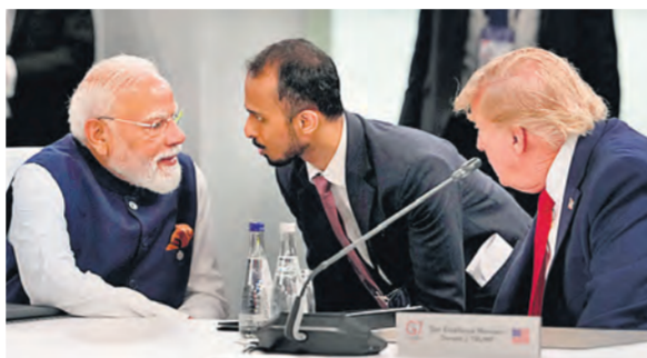
प्रधानमंत्री नरेंद्र मोदी और राष्ट्रपति डोनाल्ड ट्रंप जी-7 समिट के दौरान आपस में बातचीत करते हुए।

जैसे विषयों ने दोनों देशों के संबंधों में कुछ चुनौतियां पैदा की थीं। बुधवार शाम प्रस्तावित औपचारिक वार्ता में दोनों देशों के बीच व्यापार समझौते, रक्षा सहयोग, हिंद-प्रशांत क्षेत्र की रणनीति पर चर्चा होने की संभावना है।