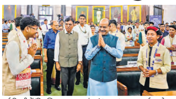
नई दिल्ली में 'विकसित भारत युवा संसद' (VBYP) 2026 कार्यक्रम के दौरान लोकसभा स्पीकर ओम बिरला प्रतिभागियों से बातचीत करते हुए।

बिरला यहां संविधान सदन के ऐतिहासिक केंद्रीय कक्ष में विकसित भारत युवा संसद 2026 का उद्घाटन कर रहे थे। यह कार्यक्रम युवा कार्यक्रम और खेल मंत्रालय द्वारा लोक सभा सचिवालय के संसदीय लोकतंत्र शोध एवं प्रशिक्षण संस्थान (प्राइड) के सहयोग से आयोजित किया गया। देश भर से आए युवा प्रतिभागियों को संबोधित करते हुए बिरला ने युवाओं से आग्रह किया कि वे इस ऐतिहासिक स्थल से प्रेरणा लेकर विकसित भारत के सपने को साकार करने की दिशा में काम करें। भारत की लोकतांत्रिक प्रक्रिया में युवाओं की व्यापक भागीदारी को रेखांकित करते हुए बिरला ने बताया कि अब 50 लाख से अधिक युवा सक्रिय रूप से युवा संसद कार्यक्रम से जुड़े हुए हैं। यहां विभिन्न राज्यों, भाषाओं