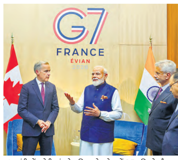
प्रधानमंत्री नरेंद्र मोदी फ्रांस के एवियन-लेस-बेन्स में G-7 समिट के दौरान अपने कनाडाई समकक्ष मार्क कार्नी के साथ चर्चा करते हुए।