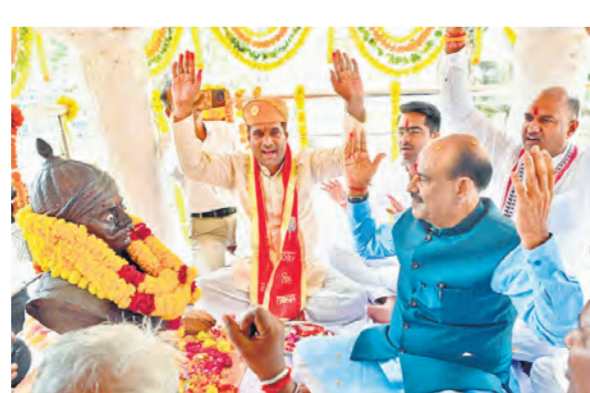
शिरोमणि महाराणा प्रताप की जय जयकार करते हुए लोकसभा अध्यक्ष ओम बिरला और सांसद सीपी जोशी सहित अन्य।