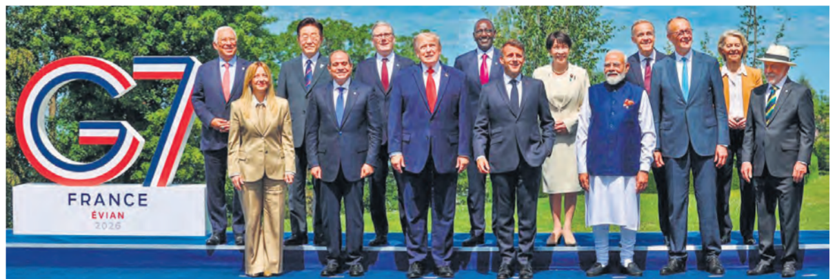
जी-7 समिट: फ्रांस के एवियॉन-लेस-बेन्स में जी-7 समिट में ग्रुप फोटो में पहली पंक्ति में (बाएं से) इटली की प्रधानमंत्री जिओर्जिया मेलोनी, मिस्र के प्रेसिडेंट अब्देल फतह अल-सिसी, अमेरिकी प्रेसिडेंट डोनाल्ड ट्रंप, फ्रांस के प्रेसिडेंट इमैनुएल मैक्रॉन, भारत के प्रधानमंत्री नरेंद्र मोदी, जर्मनी के चांसलर फ्रेडरिक मर्ज, ब्राजील के प्रेसिडेंट लुइज इनासियो लुला डा सिलवा। दूसरी पंक्ति में (बाएं से) यूरोपियन काउंसिल के प्रेसिडेंट एंटीोनियो कोस्टा, दक्षिण कोरिया के प्रेसिडेंट ली जे य्गुंग, ब्रिटेन के प्रधानमंत्री कीर स्टार्मर, केन्या के प्रेसिडेंट विलियम रूतो, जापान की प्रधानमंत्री सनाए तकाइची, कनाडा के प्रधानमंत्री मार्क कार्नो और यूरोपियन कमिशन की प्रेसिडेंट उर्सुला वॉन डेर लैयेन।

जैसे विषयों ने दोनों देशों के संबंधों में कुछ चुनौतियां पैदा की थीं। बुधवार शाम प्रस्तावित औपचारिक वार्ता में दोनों देशों के बीच व्यापार समझौते, रक्षा सहयोग, हिंद-प्रशांत क्षेत्र की रणनीति पर चर्चा होने की संभावना है।