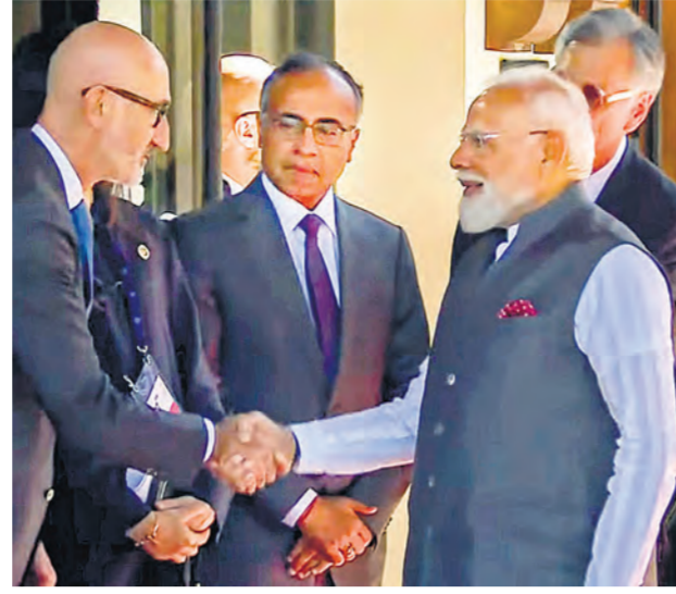
फ्रांस के एवियन में G7 समिट के लिए पहुंचने पर प्रधानमंत्री नरेंद्र मोदी का स्वागत करते फ्रांसीसी नेता।