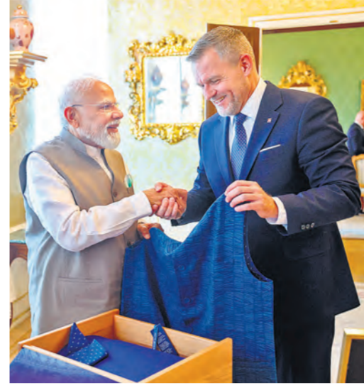
प्रधानमंत्री नरेंद्र मोदी और स्लोवाकिया के राष्ट्रपति पीटर पेल्लेग्रिनी स्लोवाकिया में एक-दूसरे को तोहफे देने हुए।