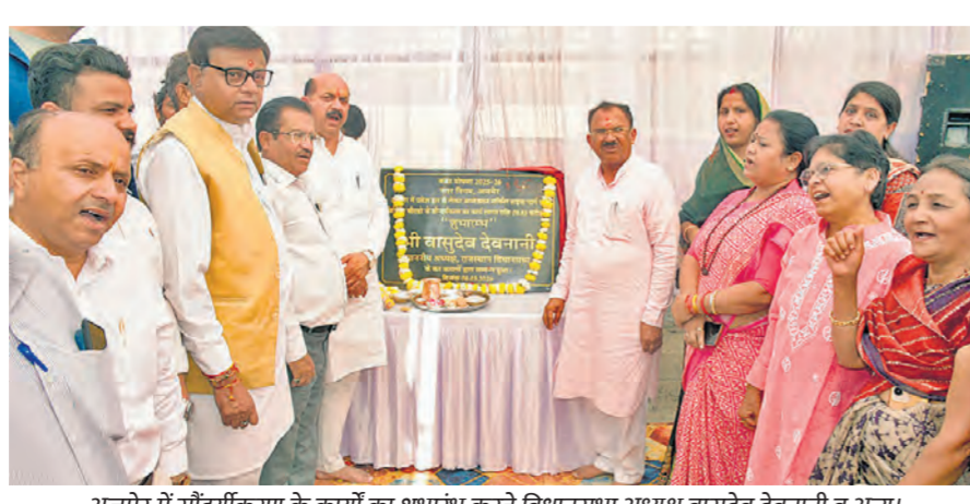
अजमेर में सौंदर्यीकरण के कार्यों का शुभारंभ करते विधानसभा अध्यक्ष वासुदेव देवनानी व अन्य।

बेधड़क। अजमेर शहर को अधिक आकर्षक और व्यवस्थित बनाने की दिशा में महत्वपूर्ण कदम उठाते हुए विधानसभा अध्यक्ष वासुदेव देवनानी ने अजमेर की जयपुर रोड पर होने वाले सौंदर्यीकरण कार्य का शुभारंभ किया। इस परियोजना पर करीब 9 करोड़ रुपए खर्च किए जाएंगे, जबकि 3 करोड़ रुपए की लागत से भव्य प्रवेश द्वार का निर्माण भी किया जा रहा है। इस प्रकार कुल 12 करोड़ रुपए की लागत से यह विकास कार्य पूरे किए जाएंगे। सौंदर्यीकरण परियोजना के तहत जयपुर रोड को आधुनिक और आकर्षक स्वरूप दिया जाएगा। योजना के अंतर्गत