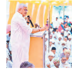
बनी रहती थी। उन्होंने कहा कि शेखासर तालाब 70 गांवों के लिए जल का आधार है। 18 महीने पूर्व शुरू किए गए जीर्णोद्धार कार्य

केंद्रीय संस्कृति एवं पर्यटन मंत्री जगदीश शंकर शेखावत ने रविवार को शेखासर तालाब पर सीएसआर के तहत करवाए गए जीर्णोद्धार और सौंदर्यीकरण कार्यों का लोकार्पण किया। इस मौके पर शेखावत ने कहा कि जल संचय हमारी लोक संस्कृति का मूल आधार रहा है। हमारे पूर्वज तालाबों, कुंडों और बावड़ियों के माध्यम से वर्षा जल का संरक्षण करते थे, जिससे लंबे समय तक जल की उपलब्धता