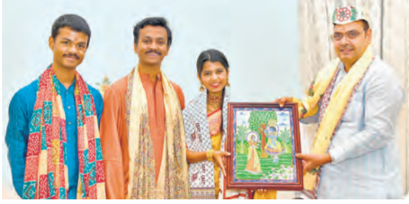
सीएम भजनलाल शर्मा से रविवार को मुख्यमंत्री निवास पर बिहार के दरभंगा जिले की अलीनगर विधानसभा सीट से विधायक और फेमस लोक गायिका सुश्री मैथिली ठाकुर ने शिष्टाचार भेंट की। इस दौरान सांस्कृतिक विरासत और लोक कलाओं के संरक्षण एवं संवर्धन के विषय पर बातचीत हुई।