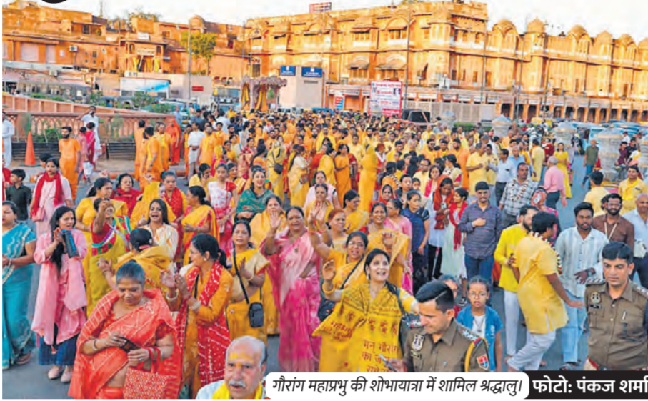
गौरांग महाप्रभु की शोभायात्रा में शामिल श्रद्धालु।

शोभायात्रा में गोपीनाथ मंदिर, विनोद लालजी, राधा दामोदर, मदन गोपाल मंदिर के भक्तजन शामिल हुए। महिला श्रद्धालु राधा-कृष्ण भजनों पर नृत्य करती रहीं। मंडली ने गौरांग महाप्रभु की लीलाओं से जुड़ी झांकियों से उनके जीवन चरित्र का परिचय लोगों को कराया। मृदंग और मंजीर की धुनों पर मंडली हरे कृष्ण महामंत्र का संकीर्तन करते हुए चल रही थी।