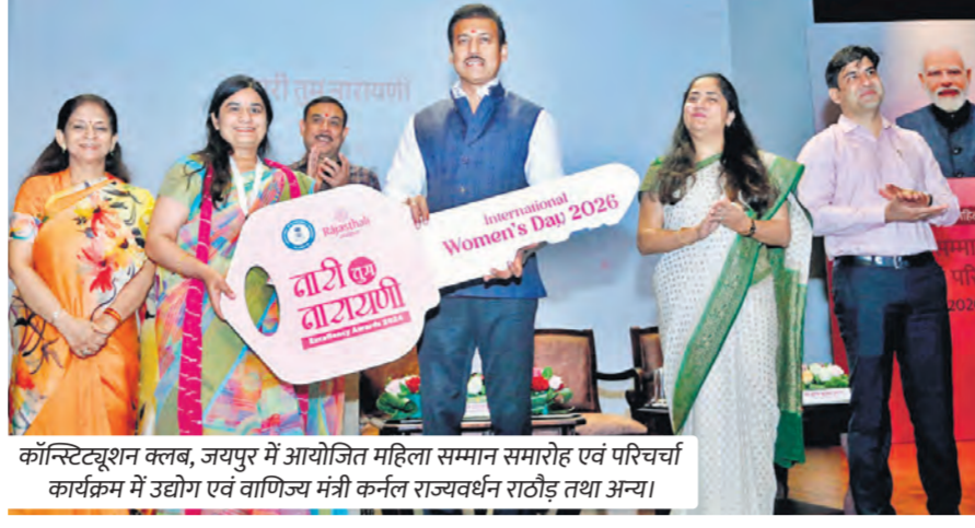
कॉन्स्ट्रूशन क्लब, जयपुर में आयोजित महिला सम्मान समारोह एवं परिचर्चा कार्यक्रम में उद्योग एवं वाणिज्य मंत्री कर्नल राज्यवर्धन राठौड़ तथा अया।

बेधड़क। जयपुर। जयपुर सहित राजस्थान के विभिन्न जिलों में रविवार को अंतरराष्ट्रीय महिला दिवस बड़े उत्साह और जोश के साथ मनाया गया। इस अवसर पर महिलाओं के सशक्तीकरण, उपलब्धियों और समानता को बढ़ावा देने के लिए सरकारी, सामाजिक और सांस्कृतिक कार्यक्रम आयोजित किए गए। राज्य सरकार ने महिलाओं को विशेष सौगात दी, जिसमें राजस्थान रोडवेज की सभी साधारण बसों में महिलाओं और बालिकाओं के लिए मुफ्त यात्रा सुविधा शामिल रही। जयपुर में ऐतिहासिक स्थलों-होवामहल, अमर किला, जंतर-मंतर, नाहरगढ़ किला और अल्वर्ट हॉल में महिलाओं के लिए फ्री पेंट्री का प्रावधान किया गया। इसके साथ ही स्वास्थ्य जागरूकता, आत्मरक्षा और सम्मान कार्यक्रम आयोजित किए गए, जिससे महिलाओं की भागीदारी बढ़ी और उनके अधिकारों के प्रति जागरूकता फैली। कॉन्स्ट्रूशन क्लब, जयपुर में आयोजित महिला सम्मान समारोह एवं परिचर्चा कार्यक्रम में उद्योग एवं वाणिज्य मंत्री कर्नल राज्यवर्धन राठौड़ तथा अया।