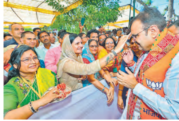
चूरू प्रवास के दौरान पूर्व नेता प्रतिपक्ष राजेंद्र सिंह राठौड़ के आवास पर आयोजित स्नेह मिलन कार्यक्रम में सीएम भजनलाल शर्मा का अभिनंदन करती महिलाएं।