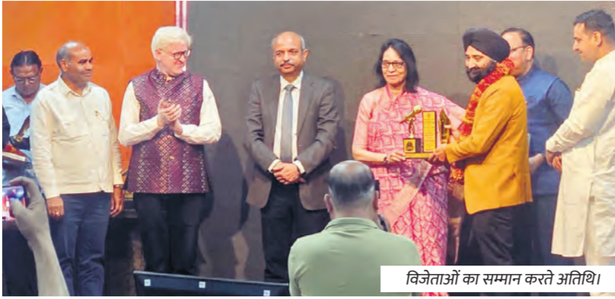
विजेताओं का सम्मान करते अतिथि।