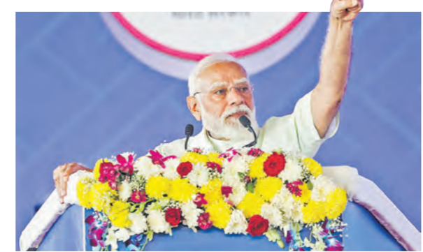
महिला दिवस के मौके पर इस तरह की घटना बेहद चिंताजनक है। उन्होंने आरोप लगाया कि तृणमूल कांग्रेस सरकार के कारण

प्रधानमंत्री नरेंद्र मोदी ने पश्चिम बंगाल में राष्ट्रपति द्रौपदी मुर्मू के कथित प्रोटोकॉल उल्लंघन को लेकर तृणमूल कांग्रेस सरकार पर रविवार को तीखा हमला बोला और कहा कि राज्य की जागरूक जनता देश की राष्ट्रपति और एक आदिवासी महिला नेता का 'अपमान' करने के लिए तृणमूल कांग्रेस को कभी माफ नहीं करेगी। राष्ट्रीय राजधानी में दिल्ली मेट्रो के दो नए कॉरिडोर और अन्य परियोजनाओं का उद्घाटन करने के बाद मोदी ने कहा कि अंतरराष्ट्रीय