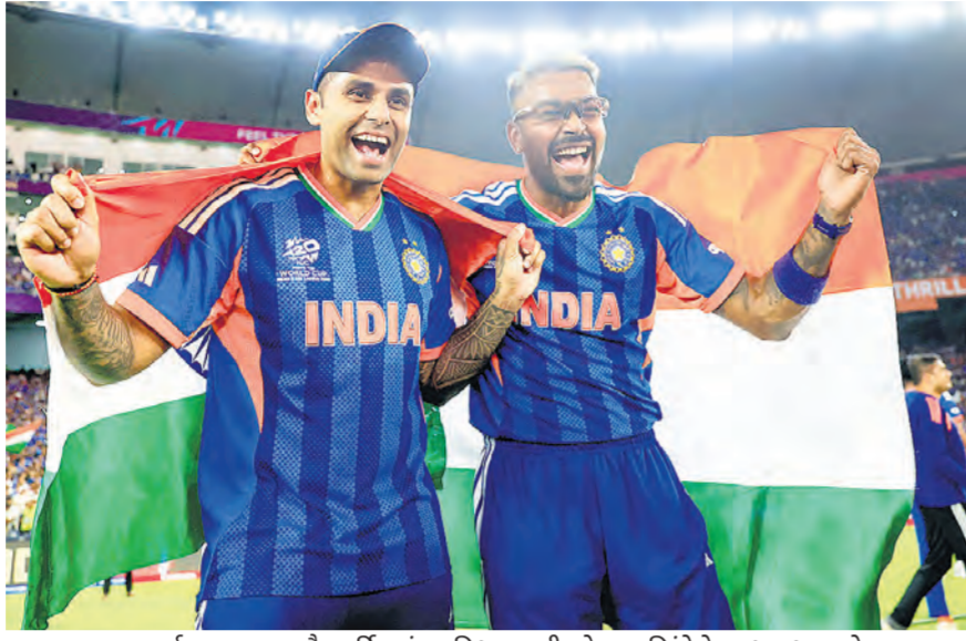
कप्तान सूर्यकुमार यादव और हार्दिक पंड्या विश्व कप जीत के बाद तिरंगे के साथ जश्न मनाते हुए।

एजेंसी | अहमदाबाद सूर्यकुमार यादव की टीम ने भारतीय क्रिकेट का एक और स्वर्णिम अध्याय लिखते हुए रविवार को न्यूजीलैंड को 96 रन से हराकर भारत को तीसरी बार टी20 विश्व कप दिलाया, जिसमें संजू सैमसन की भूमिका अहम रही तो जसप्रीत बुमराह के योगदान को भी याद रखा जाएगा। भारतीय टीम लगातार दूसरी बार टी20 विश्व कप जीतने वाली पहली पुरुष अंतरराष्ट्रीय क्रिकेट टीम बनी। इसके साथ ही तीन साल पहले इसी मैदान पर आस्ट्रेलिया से वनडे विश्व कप फाइनल हारने वाली रहित शर्मा की टीम के पुराने जख्मों पर भी महम लग गया। संजू सैमसन ने 46 गेंद में 89 और अभिषेक शर्मा ने 21 गेंद में 52 रन बनाकर भारत को पावरप्ले में ही 98 रन तक पहुंचाते हुए जीत की नींव रख दी थी। भारत ने पहले बल्लेबाजी के लिए भेजे जाने पर पांच विकेट पर 255 रन बनाए। न्यूजीलैंड के कप्तान मिचेल सैंटनेर को कोल मेकोंची की जगह जैकब डर्फी को अंतिम एकादश में उतारने का खामियाजा भुगतना पड़ा।