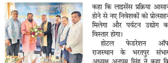
मार्ट आयोजित किए जाने सहित पर्यटन से जुड़े कई महत्वपूर्ण मुद्दों पर विस्तृत चर्चा की गई।

बेधड़क। भरतपुर होटल फेडरेशन ऑफ राजस्थान और भरतपुर होटल एसोसिएशन की संयुक्त बैठक भरतपुर स्थित होटल उदय विलास पैलेस में आयोजित की गई। बैठक में पर्यटन नीति 2026, होटल व्यवसाय से जुड़े विभिन्न लाइसेंसों के सरलीकरण तथा भरतपुर में ट्रेवल