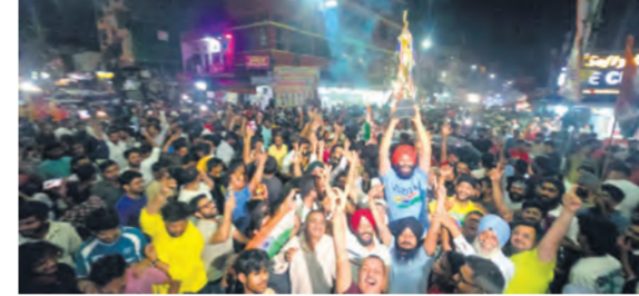
मुलाबी नगरी के राजापार्क में भारत की जीत पर जश्न मनाते लोग।