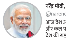
नरेंद्र मोदी, प्रधानमंत्री @narendramodi

1989, राजस्थान स्टाम्प अधिनियम 1998, राजस्थान नगरपालिका अधिनियम 2009 और राजस्थान जल आपूर्ति एवं सीवरेज अधिनियम 2018 जैसे प्रमुख कानून शामिल हैं। न्यायालयों में लंबित मामलों की स्थिति भी चिंता का विषय है। केंद्रीय विधि एवं न्याय मंत्रालय के आंकड़ों के अनुसार देश के उच्च न्यायालयों और जिला न्यायालयों में लाखों मुकदमे वर्षों से लंबित हैं। इनमें कई मामले ऐसे भी हैं जो दशकों से निर्णय की प्रतीक्षा कर रहे हैं। दस वर्ष या उससे अधिक समय से लंबित मामलों की संख्या भी काफी बढ़ी है। यह स्थिति न्याय व्यवस्था के सामने गंभीर चुनौती प्रस्तुत करती है। ऐसे में यह स्वाभाविक उठता है कि जिन मामलों को प्रशासनिक प्रतिष्ठानों का तय समय से अधिक देर तक खुला रहना, दस्तावेज प्रस्तुत करने में देरी, बिना लाइसेंस के भंडारण या अन्य प्रक्रियात्मक चूक जैसे मामलों में पहले जेल की सजा का प्रावधान था। अब इन मामलों में जेल के स्थान पर जुर्माना लगाने का प्रावधान किया गया है। इससे न केवल त्वरित कार्रवाई संभव होगी, बल्कि राजकोष को भी तत्काल राजस्व प्राप्त हो सकेगा। इस बदलाव का एक बड़ा लाभ यह भी होगा कि लोगों को ऐसे मामलों में जेल जाने या जमानत मिलने तक बंद रहने जैसी स्थितियों का सामना नहीं करना पड़ेगा। साथ ही न्यायालयों में मुकदमों का दबाव भी कुछ हद तक कम होगा, जिससे समय और संसाधनों की बचत संभव है। राजस्थान विधानसभा में जिन कानूनों में संशोधन किया गया है, उनमें राजस्थान वन अधिनियम 1953, राजस्थान टेनेसी अधिनियम 1955, राजस्थान वेयरहाउस अधिनियम 1958, राजस्थान सहायता उद्योग अधिनियम 1961, राजस्थान विद्युत शुल्क अधिनियम 1961, राजस्थान साक्षर अधिनियम 1963, राजस्थान गैरसरकारी शैक्षिक अधिनियम