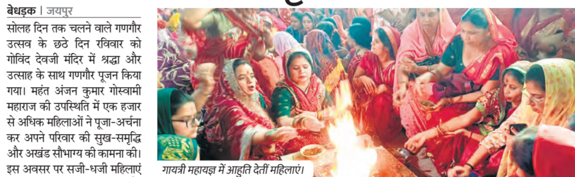
गायत्री महायज्ञ में आहुति देती महिलाएं।