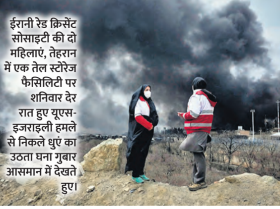
ईरान ने रड क्रिसेंट सोसाइटी की दो महिलाएं, तेहरान में एक तेल स्टोरेज फैसिलिटी पर शनिवार देर रात हुए यूएस-इजराइली हमले से निकले धुएं का उठता घना गुबार आसमान में देखते हुए।

ईरान के विदेश मंत्री अब्बास अराघची ने कहा है कि देश के नए सुप्रीम लीडर का चयन पूरी तरह ईरान का आंतरिक मामला है और इसमें किसी भी बाहरी शक्ति का दखल स्वीकार नहीं किया जाएगा। उनका यह बयान अमेरिकी राष्ट्रपति डोनाल्ड ट्रंप की उस टिप्पणी के बाद आया है, जिसमें उन्होंने कहा था कि नए सुप्रीम लीडर के चयन में अमेरिका की भूमिका जरूरी है। एनबीसी न्यूज को दिए इंटरव्यू में अराघची ने स्पष्ट कहा कि सुप्रीम लीडर का चयन ईरान की जनता और वहां की संवैधानिक संस्थाओं का अधिकार है। उन्होंने यह भी कहा कि राष्ट्रपति, कैबिनेट और संसद समेत देश की सभी राजनीतिक संस्थाएं सामान्य रूप से काम कर रही हैं।