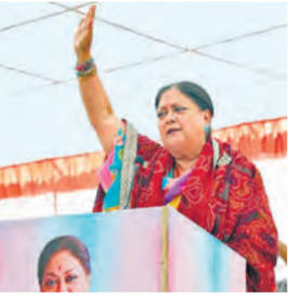
अवसर और सशक्त भागीदारी ही सशक्त समाज और समृद्ध राष्ट्र की पहचान है। उन्होंने 'Give To Gain' की भावना के साथ

पूर्व मुख्यमंत्री वसुंधरा राजे ने अंतरराष्ट्रीय महिला दिवस के अवसर पर प्रदेश की सभी महिलाओं को शुभकामनाएं दी हैं। अपने सोशल मीडिया पोस्ट में उन्होंने कहा कि नारी न केवल परिवार की आधारशिला है, बल्कि समाज और राष्ट्र की प्रगति की प्रेरणा भी है। राजे ने महिलाओं के साहस, प्रश्रम और संकल्प की सराहना करते हुए कहा कि नारी सम्मान, समान