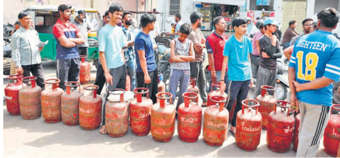
तालकटोरा के पास गैस सिलेंडर लेने के लिए लगी लोगों की कतार।