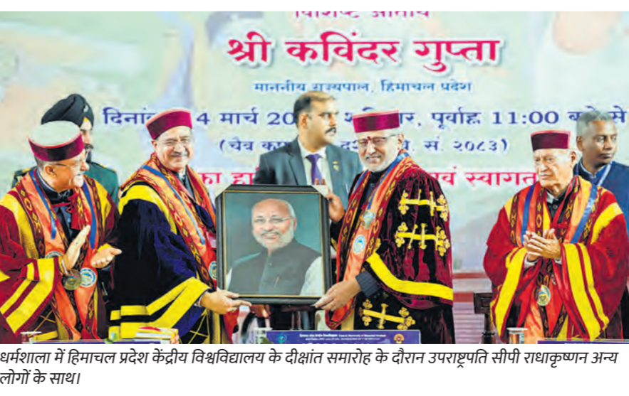
धर्मशाला में हिमाचल प्रदेश केंद्रीय विश्वविद्यालय के दीक्षांत समारोह के दौरान उपराष्ट्रपति सीपी राधाकृष्णन अन्य लोगों के साथ।