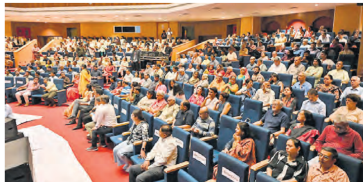
सभागार में संगीत का आनंद लेते श्रोता।

एकाग्रता और भावनात्मक गहराई का वातावरण रच दिया। स्नातक प्रस्तुति में परंपरा की गंभीरता और सहज अभिव्यक्ति का अद्भुत संतुलन देखने को मिला। कार्यक्रम के दौरान सरोद और तबले के बीच सवाल-जवाब