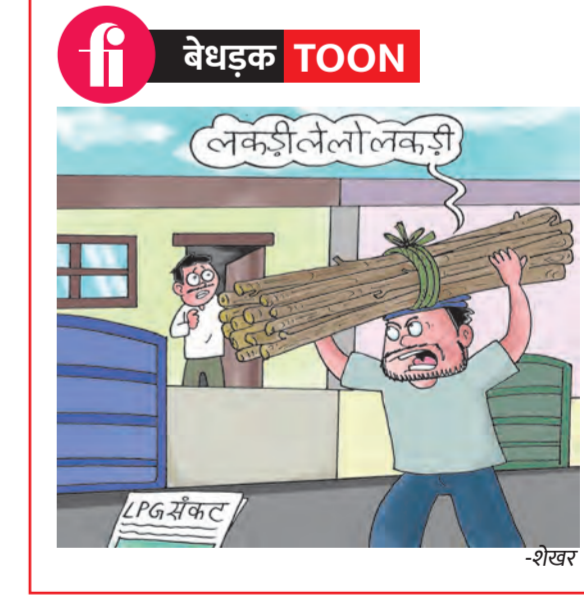
लेकड़ी लेली लेकड़ी