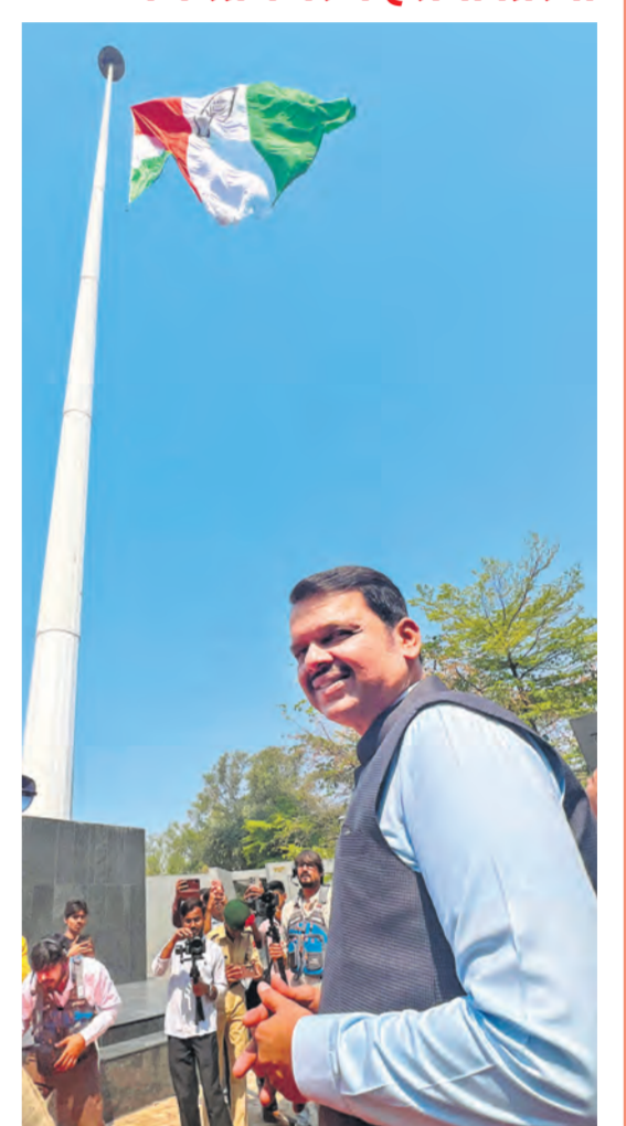
नागपुर। महाराष्ट्र के मुख्यमंत्री देवेंद्र फडणवीस ने शनिवार को नागपुर के कस्तूरचंद पार्क में 200 फीट ऊंचे ध्वज स्तंभ का अनावरण करते हुए वहां राष्ट्रीय ध्वज फहराया। लोकमत मीडिया द्वारा जारी एक विज्ञापित के अनुसार, 200 फीट की ऊंचाई के साथ यह क्षेत्र के सबसे ऊंचे ध्वज स्तंभों में से एक होगा, जिस पर 60 फीट लंबा और 40 फीट चौड़ा तिरंगा लहराएगा। यह विविधता में एकता, धर्मनिरपेक्षता और संविधान की लोकतांत्रिक भावना का प्रतीक है।