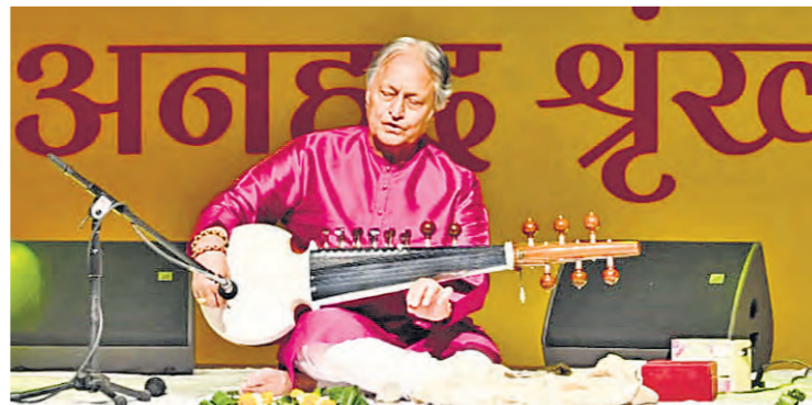
कार्यक्रम में प्रस्तुति देते पद्मविभूषण सरोद वादक उस्ताद अमजद अलीखान।

बेधड़क | जयपुर 'अनहद' संगीत शृंखला की सातवीं कड़ी में शनिवार शाम राजस्थान इंटरनेशनल सेंटर का म्रुञ्च सभागार सरोद के मधुर और आत्मीय सुरों से गुंजायमान हो उठा। पर्यटन विभाग, राजस्थान सरकार, सिस्केमके और राजस्थान इंटरनेशनल सेंटर की ओर से आयोजित कार्यक्रम में पद्मविभूषण सरोद वादक उस्ताद अमजद अली खान ने कई वर्षों बाद जयपुर में प्रस्तुति देकर संगीत प्रेमियों को यादगार संगीतमय अनुभव दिया। उन्होंने अत्यंत श्रृंगारिक और आत्मीय शैली में राग श्यामा गौरी की प्रस्तुति दी। इस राग की शुरुआत उन्होंने गुरु वंदना से कर राग को विस्तार दिया। उनके सरोद से निकलते मधुर स्वरों ने सभागार में