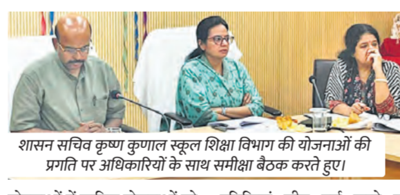
शासन सचिव कृष्ण कुणाल स्कूल शिक्षा विभाग की योजनाओं की प्रगति पर अधिकारियों के साथ समीक्षा बैठक करते हुए।

बेधड़क। जयपुर बजट घोषणा 2026-27 में स्कूल शिक्षा विभाग से जुड़ी योजनाओं और गतिविधियों को धरातल पर समयबद्ध लागू करने के लिए शिक्षा संकुल में समीक्षा बैठक आयोजित की गई। बैठक की अध्यक्षता स्कूल शिक्षा के शासन सचिव कृष्ण कुणाल ने की। उन्होंने विभागीय अधिकारियों को निर्देश दिए कि सभी लंबित कार्य 31 मार्च तक निस्तारित किए जाएं और बजट