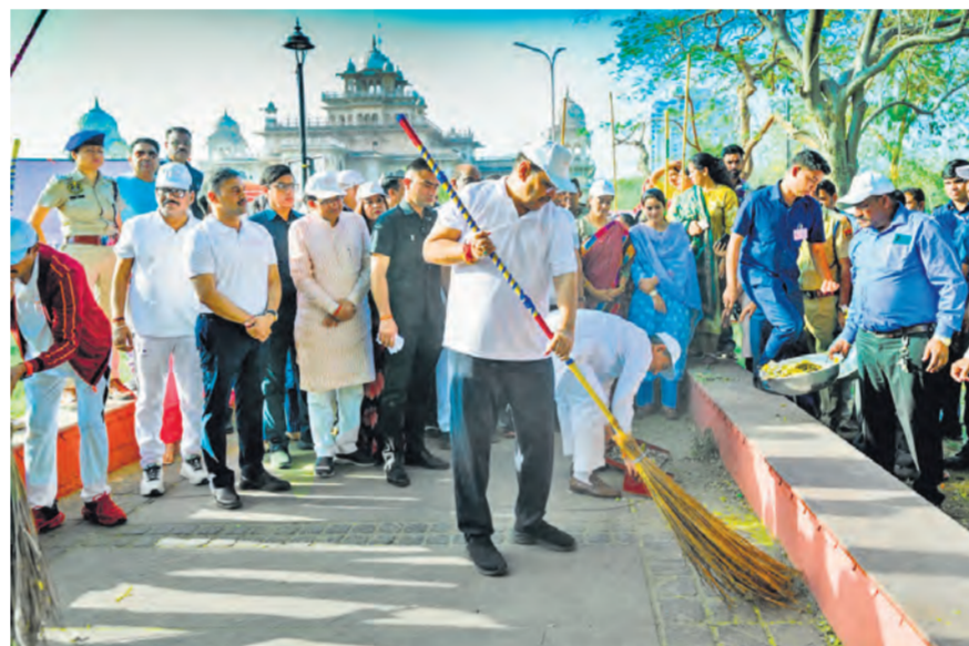
मुख्यमंत्री भजनलाल शर्मा ने शनिवार को अल्बर्ट हॉल पर श्रमदान कर स्वच्छता का संदेश दिया।

कार्यक्रम में उन्होंने नगर निगम के सफाईकर्मियों को पीपीई किट वितरित की और प्रधानमंत्री स्वनिधि योजना के लाभार्थियों को प्रतीकात्मक चेक सौंपे। मौजूद लोगों को स्वच्छता की शपथ दिलाई गई और रामनिवास बाग में पौधारोपण भी किया गया। सीएम शर्मा ने कहा कि राजस्थान दिवस के पत्र आयोजन की शुरुआत स्वच्छता से हुई है। हमारा संकल्प है कि राजस्थान आर्थिक समृद्धि के साथ स्वच्छता और स्वास्थ्य में भी देश का अग्रणी राज्य बने।