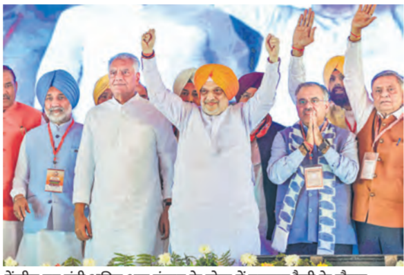
केंद्रीय गृह मंत्री अमित शाह पंजाब के मोगा में बदलाव रैली के दौरान भाजपा नेता तरुण चुघ और अन्य लोगों के साथ।

एजेंसी। नई दिल्ली। केंद्रीय गृह मंत्री अमित शाह ने शनिवार को पंजाब की भगवंत मान सरकार पर निशाना साधा और आरोप लगाया कि यह सरकार आम आदमी पार्टी (आप) के प्रमुख अरविंद केजरीवाल के लिए एक एटीएम बन गई है। उन्होंने कहा कि अगर 2027 के विधानसभा चुनावों के बाद भाजपा पंजाब में सरकार बनाती है, तो राज्य में धर्मांतरण पर प्रतिबंध लगाने के लिए कानून लाया जाएगा।