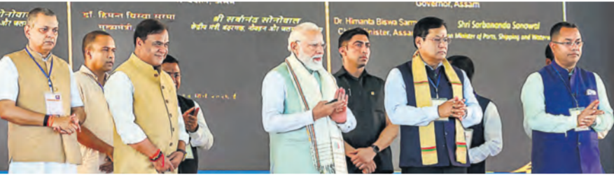
असम के सिलचर में विभिन्न विकास कार्यों के शिलान्यास और अनावरण समारोह के दौरान प्रधानमंत्री नरेंद्र मोदी (केंद्र में) के द्वािीय जहाजरांनी मंत्री सर्बाबंद सोनोवाल, असम के मुख्यमंत्री हिमंत बिस्वा सरमा और अन्य लोगों के साथ।

एजेंसी। सिलचर। प्रधानमंत्री नरेंद्र मोदी ने शनिवार को कहा कि केंद्र सरकार वैश्विक संघर्षों के कारण लोगों पर पड़ने वाले प्रभावों को न्यूनतम करने के लिए काम कर रही है। उन्होंने साथ ही आरोप लगाया कि विपक्षी पार्टी कांग्रेस देश में दहशत पैदा करने की कोशिश करके 'गैर-जिम्मेदाराना' व्यवहार कर रही है। मोदी ने असम के सिलचर में एक जनसभा को संबोधित करते हुए आरोप लगाया कि कांग्रेस ने दशकों तक पूर्वोत्तर की अनदेखी की और स्वतंत्रता के