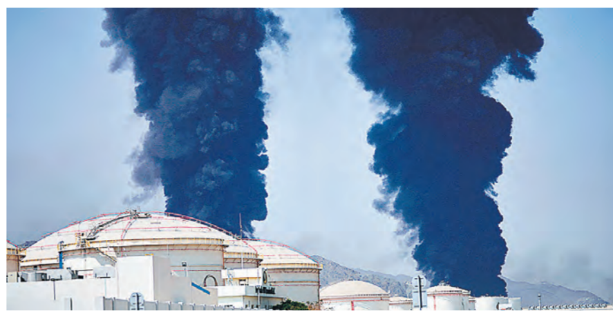
संयुक्त अरब अमीरात के फुजैराह में एक ईरानी ड्रोन का मलबा एक तेल संयंत्र से टकराने के बाद संयंत्र से उठता धुएँ का गुबार।

हुआ जबकि संयुक्त अरब अमीरात में ईरान की रोकथाम मिसाइल का मलबा तेल संयंत्र पर गिर गया। ईरान की समाचार एजेंसी 'फार्स' ने कहा कि अमेरिकी हमलों से द्वीप पर तेल अवसंरचना को कोई नुकसान नहीं पहुंचा है। ट्रंप ने कहा कि अमेरिकी बलों ने शुक्रवार को ईरान के खाग द्वीप पर स्थित लक्ष्यों को पूरी तरह नष्ट कर दिया। यह द्वीप देश के तेल निर्यात के लिए प्रार्थमिक टर्मिनल है और इसका सैन्य इस्तेमाल होता है। ईरानी संसद के अध्यक्ष ने पहले चेतावनी दी थी कि इस तरह के हमलों से एक नए स्तर की प्रतिशोभी कार्रवाई शुरू हो सकती है।