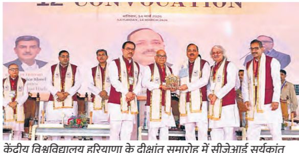
केंद्रीय विश्वविद्यालय हरियाणा के दीक्षांत समारोह में सीजेआई सूर्यकांत अन्य लोगों के साथ।

डिग्री उनके द्वारा अर्जित ज्ञान को प्रमाणित करती है और उन्हें इस पर गर्व होना चाहिए। उन्होंने कहा कि यह मौका उनके लिए निजी तौर पर खास मायने रखता है। हरियाणा में पले-बढ़े और अपनी पढ़ाई पूरी करने के बाद, उन्होंने अपने कैरियर के शुरुआती दौर में आई मुश्किलों और अपने अनुभवों का जिक्र किया और उनको छात्र-छात्राओं के साथ साझा किया। उन्होंने खासकर मध्यमवर्गीय परिवारों से आने वाले छात्र-छात्राओं को भरोसा दिलाया कि