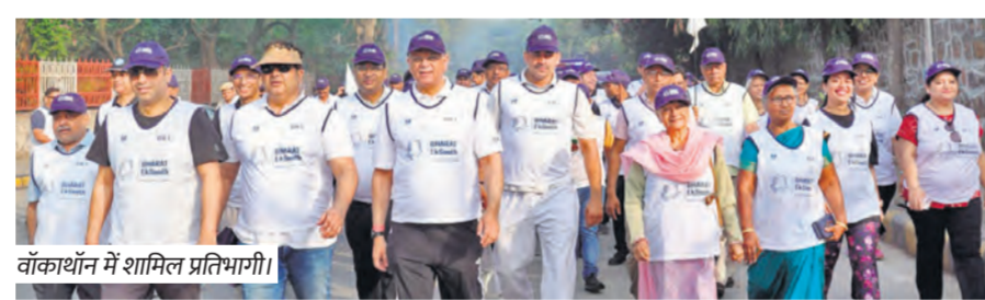
वॉकथॉन में शामिल प्रतिभागियों।