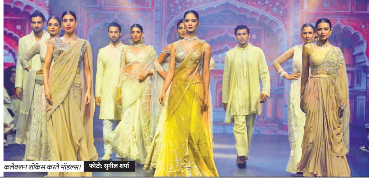
कलेक्शन शोकेस करते मॉडलस।

किया, वहीं शो डायरेक्टर लोकेश शर्मा को शानदार प्रस्तुति के लिए सराहा गया।