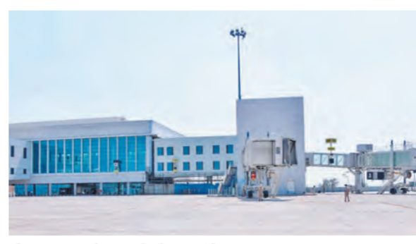
नोएडा अंतरराष्ट्रीय हवाई अड्डे का टर्मिनल भवन।

निभाई। उन्होंने मुख्यमंत्री को सभी जरूरी पहलुओं के बारे में जानकारी दी, जिसमें निर्माण की प्रगति, पैसेंजर टर्मिनलों की तैयारी, सुरक्षा इंतजाम, ट्रेफिक मैनेजमेंट