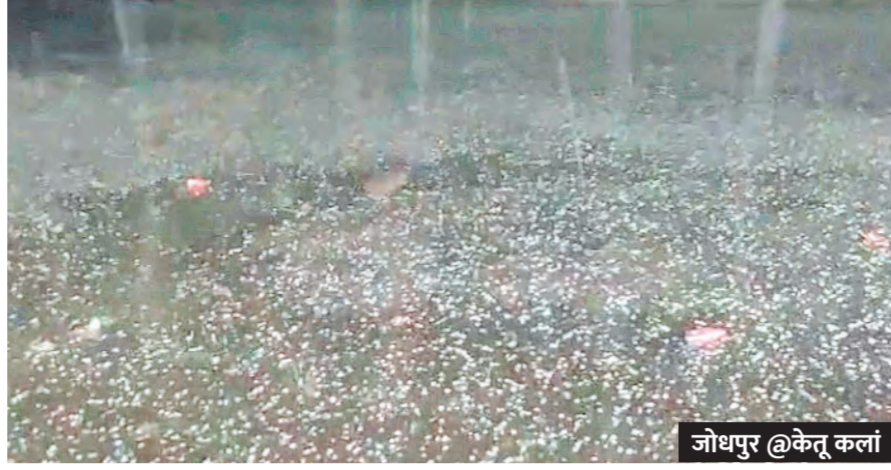
जोधपुर @केतू कला

बेधड़क | जयपुर प्रदेश में मौसम का मिजाज बदलता नजर आ रहा है। मौसम विज्ञान केंद्र जयपुर के अनुसार, रविवार को राज्य के पश्चिमी और उत्तरी हिस्सों में पश्चिमी विक्षोभ के प्रभाव से हल्की से मध्यम बारिश दर्ज की गई। येलो अलर्ट जारी होने के बाद जैसलमेर, जोधपुर, बीकानेर, बाड़मेर, पाली और नागौर जिलों में अलग-अलग स्थानों पर मेघगर्जन के साथ बूंदबांदी हुई। कुछ इलाकों में तेज हवाएं चलीं, जबकि जोधपुर सहित अन्य स्थानों पर तेज आंधी के साथ बारिश और ओले भी गिरे। शनिवार से रविवार सुबह