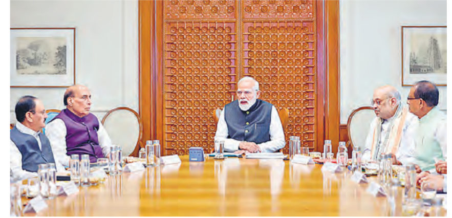
पीएम आवास पर आयोजित बैठक में प्रधानमंत्री नरेंद्र मोदी के साथ (बाएं से दाएं) केंद्रीय स्वास्थ्य मंत्री जेपी नड्डा, रक्षा मंत्री राजनाथ सिंह, गृह मंत्री अमित शाह और कृषि मंत्री शिवराज सिंह चौहान।