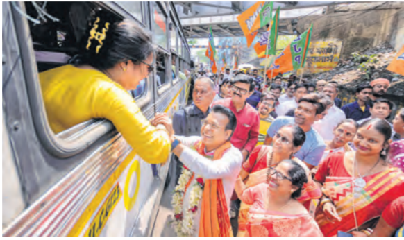
शिवपुर विधानसभा क्षेत्र में प्रचार अभियान के दौरान एक महिला से बातचीत करते हुए लोग।