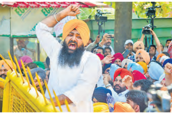
एक अधिकारी के आत्महत्या के मामले को लेकर चंडीगढ़ में पंजाब की आप सरकार के खिलाफ प्रदर्शन करते विपक्षी दलों के कार्यकर्ता।