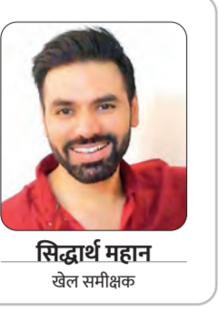
सिद्धार्थ महान खेल समीक्षक