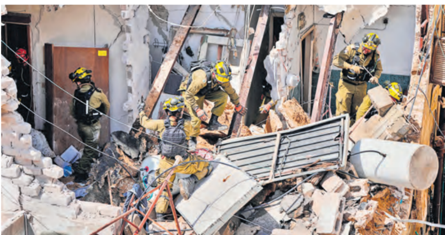
इजराइल के तेल अवीव में ईरान के मिसाइल हमले में क्षतिग्रस्त एक अपार्टमेंट की बिल्डिंग का मुआयना करते इजराइल के सुरक्षा अधिकारी।

एजेंसी। काहिरा खाड़ी क्षेत्र में अमेरिका व इजराइल तथा ईरान के साथ जारी संघर्ष के बीच अमेरिकी राष्ट्रपति डोनाल्ड ट्रंप ने चेतावनी दी कि अगर ईरान 48 घंटे के भीतर होर्मुज जलडमरूमध्य को पूरी तरह नहीं खोलता है तो अमेरिका उसके ऊर्जा संयंत्रों को नेस्तनाबूद कर देगा। वहीं, ईरान के एक वरिष्ठ अधिकारी ने कहा कि होर्मुज जलडमरूमध्य ईरान के दुश्मनों से जुड़े जहाजों को छोड़कर सभी प्रकार के जहाजों के लिए खुला है।