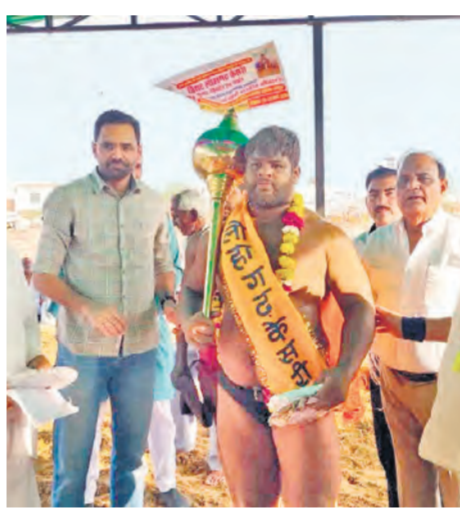
अतिथियों के साथ दंगल विजेता मोहित फोगाट।