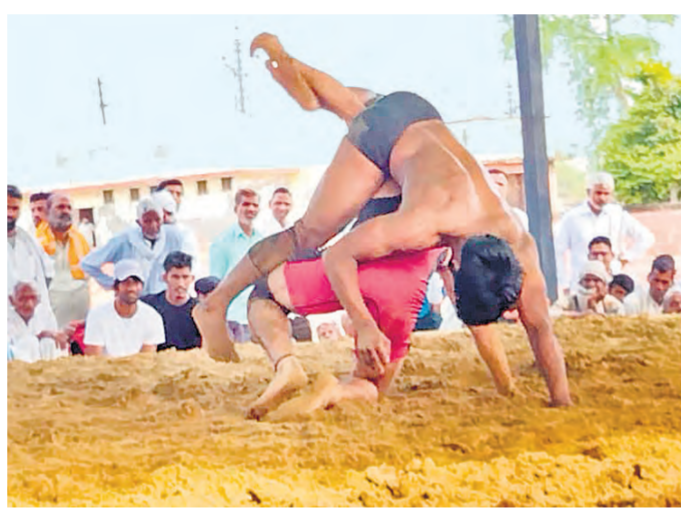
लोहागढ़ केसरी दंगल में दांव-पेंच आजमाते पहलवान।