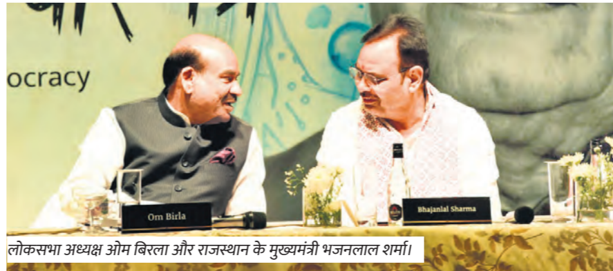
लोकसभा अध्यक्ष ओम बिरला और राजस्थान के मुख्यमंत्री भजनलाल शर्मा।