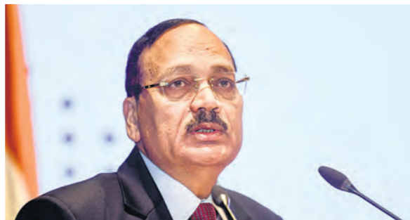
जानकारी को एक एकीकृत प्रणाली में संघटित करेगी। उन्होंने कहा कि हम एक कुशल केस प्रबंधन प्रणाली विकसित करने की दिशा में काम कर रहे हैं। उन्होंने कहा कि इस पहल से न्यायिक सूचनाओं का व्यापक और परस्पर जुड़ा हुआ डाटाबेस तैयार होगा, जिससे मामलों की निगरानी, प्रबंधन और सूचना तक पहुंच आसान होगी।

भारत के प्रधान न्यायाधीश सूर्यकांत ने न्यायिक डेटा एकीकरण को मजबूत करने और देश भर की अदालतों सेवाओं तक जनता की पहुंच में सुधार लाने के उद्देश्य से सोमवार को एक बड़ी डिजिटल पहल की घोषणा की। न्यायालय की कार्यवाही शुरू होते ही न्यायाधीश सूर्यकांत ने घोषणा की कि न्यायपालिका 'एक मामला, एक डेटा' (वन केस, वन डेटा) पहल शुरू कर रही है जो सभी उच्च न्यायालयों, जिला अदालतों और तालुका अदालतों से बहुस्तरीय