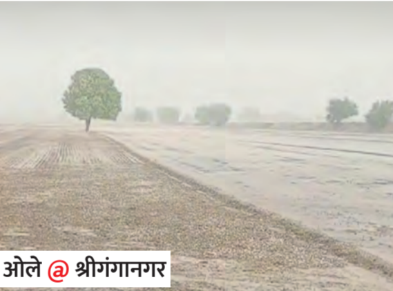
ओले @ श्रीगंगानगर

बेधड़क | जयपुर प्रदेश में भीषण गर्मी ने जनजीवन को झुलसाना शुरू कर दिया है। पिछले 24 घंटों में बाड़मेर प्रदेश का सबसे गर्म शहर रहा, जहां अधिकतम तापमान 47.3 डिग्री सेल्सियस दर्ज किया गया। प्रदेश के अन्य शहरों में भी पारा खतरनाक स्तर पर बना रहा। फरलोदी में 46.8 डिग्री, जैसलमेर में 46.5 डिग्री, बीकानेर में 45.3 डिग्री, जोधपुर शहर में 44.9 डिग्री और चित्तौड़गढ़ में 44.2 डिग्री सेल्सियस तापमान रिकॉर्ड किया गया। वहीं न्यूनतम तापमान सिरसोई में 21.3 डिग्री सेल्सियस दर्ज हुआ। राजधानी जयपुर में सोमवार को अधिकतम तापमान 39.9 डिग्री और न्यूनतम तापमान 28.2 डिग्री सेल्सियस दर्ज किया गया। अगले 24 घंटों में शहर का तापमान 43 डिग्री तक पहुंचने का अनुमान है।