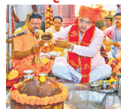
'सोमनाथ अमृत महोत्सव' के तहत जयपुर स्थित झाड़खंड महादेव मंदिर में पंचामृत अभिषेक करते हुए मुख्यमंत्री भजनलाल शर्मा।