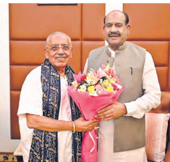
डॉ. जगदीश चंद्र ने सोमवार को नई दिल्ली स्थित लोकसभा अध्यक्ष आवास पर लोकसभा अध्यक्ष ओम बिरला से शिष्टाचार भेंट की।