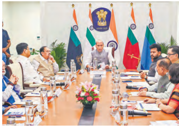
रक्षा मंत्री राजनाथ सिंह (केंद्र में) नई दिल्ली मंत्रियों के अंतर-मंत्रालयी समूह की पांचवीं बैठक की अध्यक्षता करते हुए। बैठक में केंद्रीय मंत्री जेपी नड्डा, हरदीप सिंह पुरी, के राम मोहन नायडू, किरेन रिजिजू भी मौजूद थे।

मंत्री समूह (आईजीओएम) की उच्च स्तरीय बैठक की अध्यक्षता कर रहे थे। रक्षा मंत्रालय के अनुसार बैठक में बताया गया कि देश सुरक्षित है और किसी भी पेट्रोलियम उत्पाद की कोई कमी नहीं है, जबकि अधिकांश अन्य देशों ने घरेलू ईंधन की खपत को नाटकीय रूप से कम करने के लिए आपातकालीन उपाय किए हैं। भारत के पास 60 दिनों के लिए कच्चे तेल, 60 दिनों के लिए प्राकृतिक गैस और 45 दिनों के लिए एलपीजी का स्टॉक है। विदेशी मुद्रा भंडार 703 अरब अमेरिकी डॉलर के आरामदायक स्तर पर है।