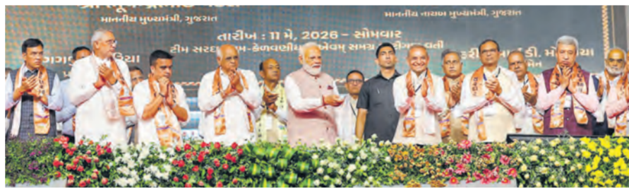
प्रधानमंत्री नरेंद्र मोदी गुजरात के मुख्यमंत्री भूपेंद्र पटेल और अन्य लोगों की उपस्थिति में वडोदरा में सरदार धाम हॉस्टल को उद्घाटन करते हुए।

प्रधानमंत्री नरेंद्र मोदी ने सोमवार को कहा कि पश्चिम एशिया का संकट इस दशक में सबसे गंभीर संकटों में से एक है। हमने जिस तरह कोविड-19 महामारी से पार पाया था, वैसे ही हम इससे भी बाहर निकल आएंगे। भारत को वैश्विक सपना चैन का एक बड़ा हिस्सा बनाने के लिए लगातार काम किया जा रहा है, ताकि देश की आर्थिक स्थिति और मजबूत हो सके। पीएम मोदी वडोदरा में पटेल समुदाय द्वारा निर्मित 'सरदार धाम हॉस्टल' का उद्घाटन करने के बाद सभा को संबोधित कर रहे थे। उन्होंने यह भी कहा कि देश ने जब भी युद्ध या बड़े संकट का