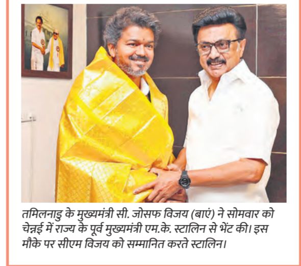
तमिलनाडु के मुख्यमंत्री सी. जोसफ विजय (बाएं) ने सोमवार को चेन्नई में राज्य के पूर्व मुख्यमंत्री एम.के. स्टालिन से भेंट की। इस मौके पर सीएम विजय को सम्मानित करते स्टालिन।