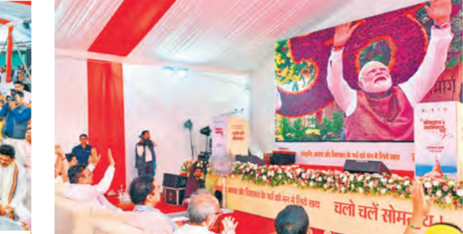
सोमनाथ मंदिर में पीएम मोदी के कार्यक्रम से वीसी के माध्यम से जुड़े सीएम।

मुख्यमंत्री ने यह भी कहा कि प्रधानमंत्री नरेंद्र मोदी के नेतृत्व में विकास भी, विरासत भी की संकल्पना को धरातल पर साकार किया जा रहा है। देशभर में धार्मिक एवं सांस्कृतिक स्थलों के पुनर्विकास से भारत की सांस्कृतिक चेतना को नई ऊर्जा मिली है। सोमनाथ अमृत महोत्सव इसी निरंतरता का प्रतीक है।