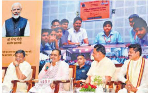
मुख्यमंत्री भजनलाल शर्मा बिड़ला ऑटोइंडियम में राष्ट्रीय प्रौद्योगिकी दिवस पर आयोजित राज्य स्तरीय समारोह को संबोधित करते हुए। साथ में मंत्री जोगाराम पटेल, संजय शर्मा और विधायक गोपाल शर्मा।

बिड़ला ऑटोइंडियम में आयोजित राज्य स्तरीय समारोह को संबोधित करते हुए मुख्यमंत्री ने युवाओं से नवाचार और अनुसंधान के क्षेत्र में आगे आने का आह्वान किया। उन्होंने कहा कि युवा संकोच छोड़कर अपने सपनों को उड़ान दें और राजस्थान को तकनीक एवं स्टार्टअप के क्षेत्र में ग्लोबल लीडर बनाने में योगदान दें। उन्होंने कहा कि 'ब्रह्मगुप्त पुरस्कार' राजस्थान की वैज्ञानिक विरासत और नई पीढ़ी के बीच एक मजबूत सेतु बनेगा। यह सम्मान विज्ञान, गणित, अनुसंधान और नवाचार के क्षेत्र में उल्लेखनीय योगदान देने वाले विद्यार्थियों, वैज्ञानिकों और शोधकर्ताओं को प्रदान किया जाएगा।