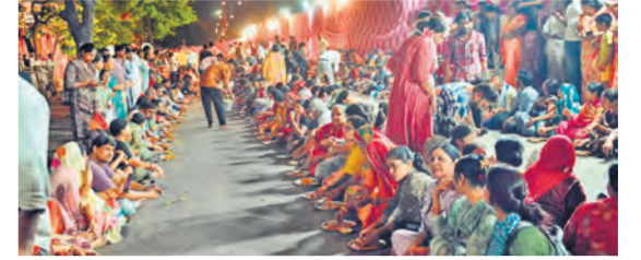
महाप्रसादी पाते श्रद्धालु।