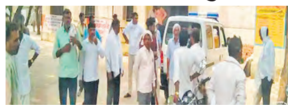
एसडीएम ऑफिस के बाहर प्रदर्शन करते ग्रामीण।