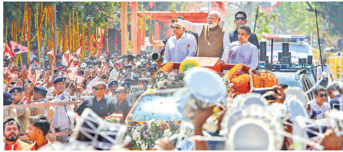
प्रधानमंत्री नरेंद्र मोदी सोमवार को गुजरात के गिर सोमनाथ जिले के वेरावल में सोमनाथ मंदिर के पास एक रोड शो के दौरान लोगों का अभिवादन करते हुए।